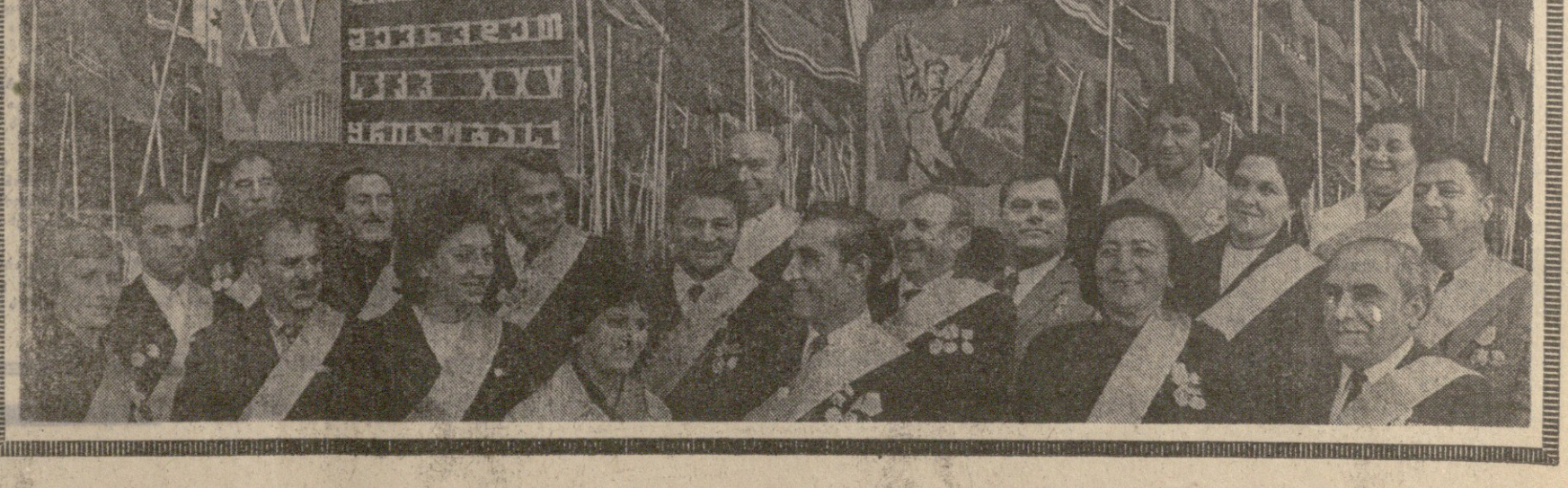
საქართველოს კომპარტიის ცენტრალური კომიტეტის წევრები