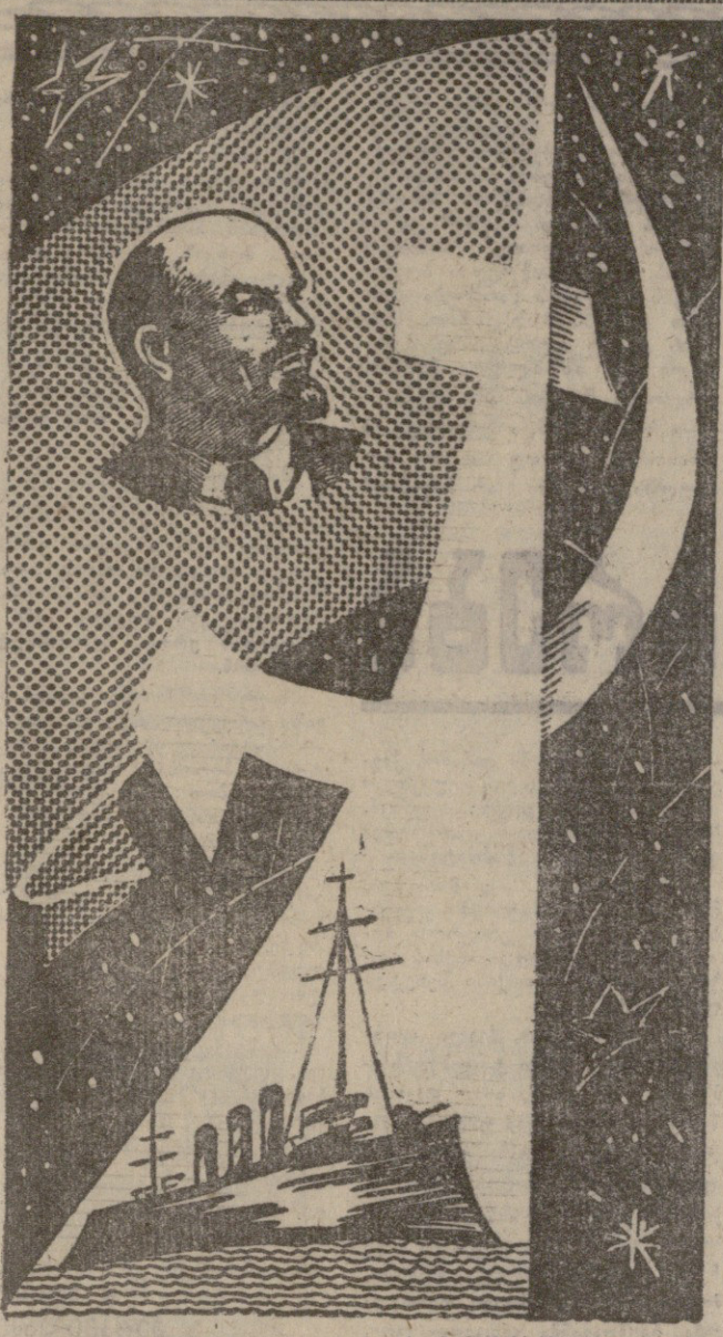
მ. მარსულის პლაკატი