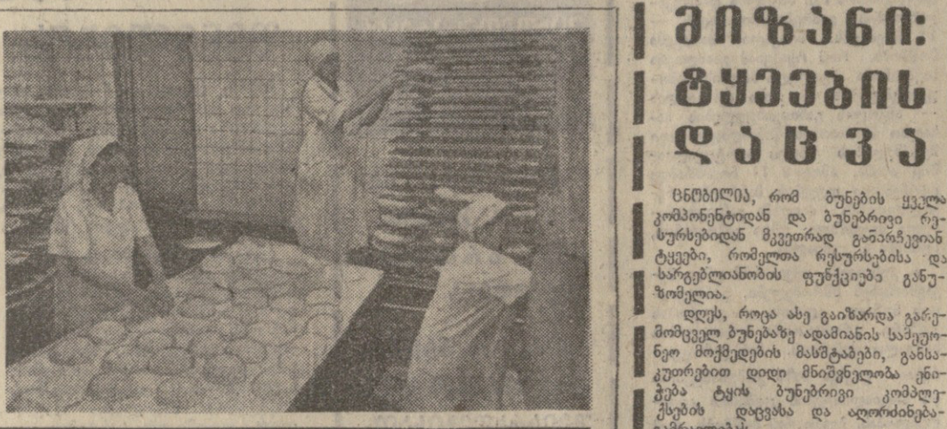
მ. გლინკას ფოტო