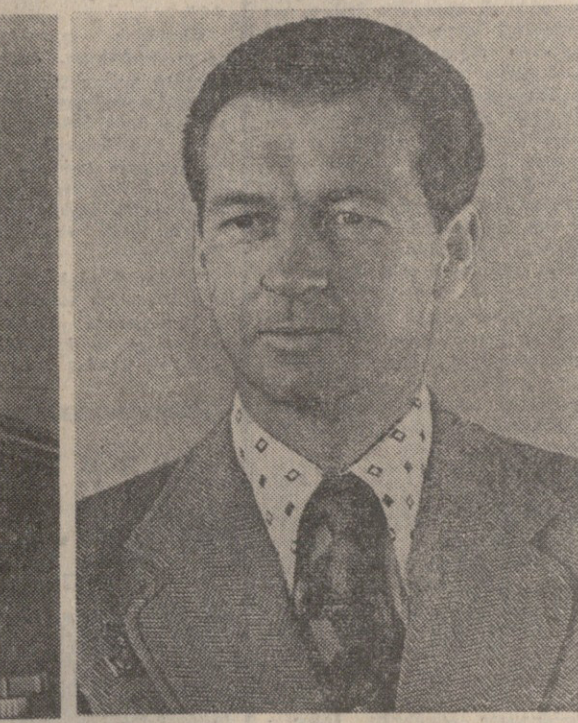
პირაი ილია-ქა კლიშვი

მეცნიერება, კონსტრუქტორებს, ინჟინერებს, ტექნიკოსებს და მუშებს, კულმინაცია და ორგანიზაციებს, რომლებიც მონაწილეობდნენ „სალუგ-4“ ორბიტული სამეცნიერო საღებურის და „სალიუგ-18“ საბრუნავი სარეზონანსო სანგარიშის ფრენის მომზადებასა და განხორციელებაში