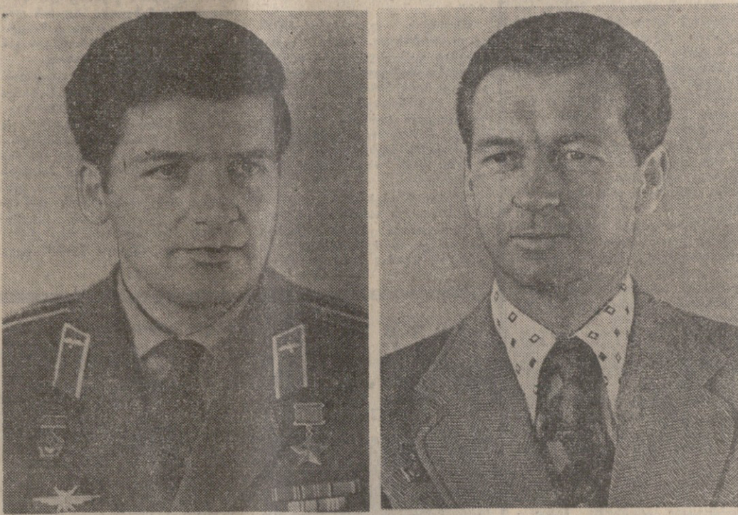
პირაი ილია-ქა კლიშვი

მეცნიერება, კონსტრუქტორებს, ინჟინერებს, ტექნიკოსებს და მუშებს, კულმინაცია და ორგანიზაციებს, რომლებიც მონაწილეობდნენ „სალუგ-4“ ორბიტული სამეცნიერო საღებურის და „სალიუგ-18“ საბრუნავი სარეზონანსო სანგარიშის ფრენის მომზადებასა და განხორციელებაში