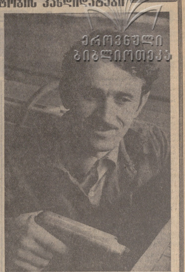
საქართველოს კავშირგაბმულობის მინისტრი

კავშირგაბმულობის მინისტრის განცხადება საქართველოს კავშირგაბმულობის მინისტრის განცხადება საქართველოს კავშირგაბმულობის მინისტრის განცხადება