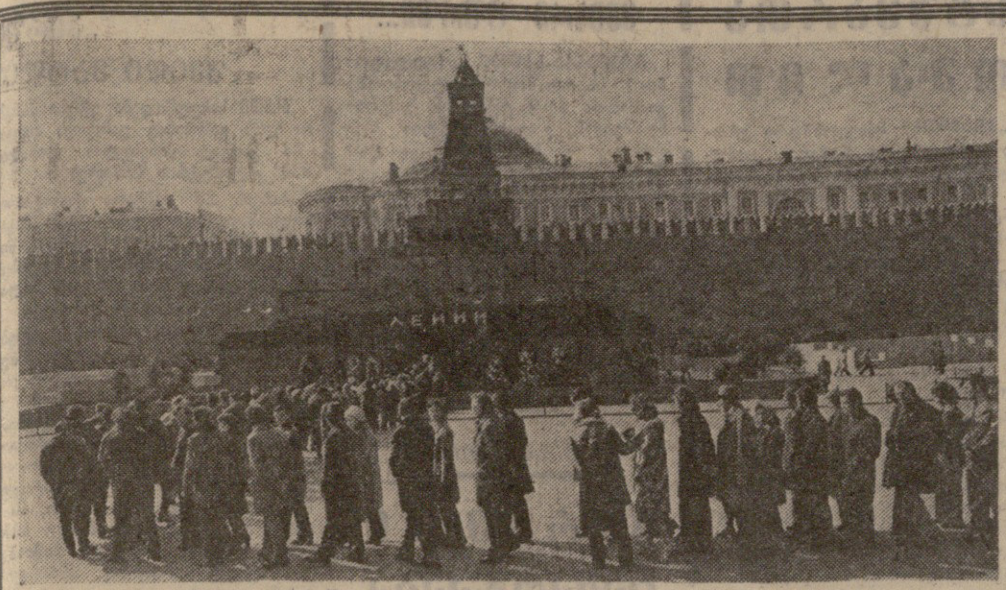
მოსკოვი. წითელი მოედანი. 3. ი. ლენინის მემორიალური მუზეუმი. 1975 წლის პერიდი. 3. ი. ლენინის და ბ. სტალინის ფოტო (საუბრის ფოტოკრიზისი).

26 დეკემბერი 3. ი. ლენინის სახელობელი მუზეუმი თბილისის უნივერსიტეტში