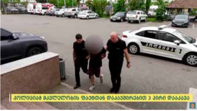
პოლიციამ გავლელობის ფაქტთან დაკავშირებით 3 პირი დააკავა

შინაგან საქმეთა სამინისტროს აჭარის პოლიციის დეპარტამენტი, მიმდინარე წლის 22 მაისს, შევიდა შეტყობინება 2003 წელს დაბადებული გ.ა.-ს გაუჩინარების შესახებ, რის საფუძველზეც პოლიციამ გამოძიება სისხლის სამართლის კოდექსის 143-ე მუხლის პირველი ნაწილით დაიწყო.