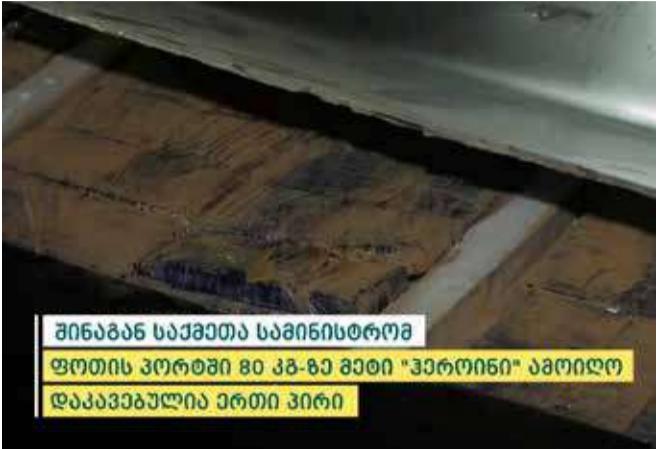
შინაგან საქმეთა სამინისტრომ ფოთის პორტში 80 კგ-ზე მეტი „ჭერი“ ამოიღო დაკავებულია ერთი პირი