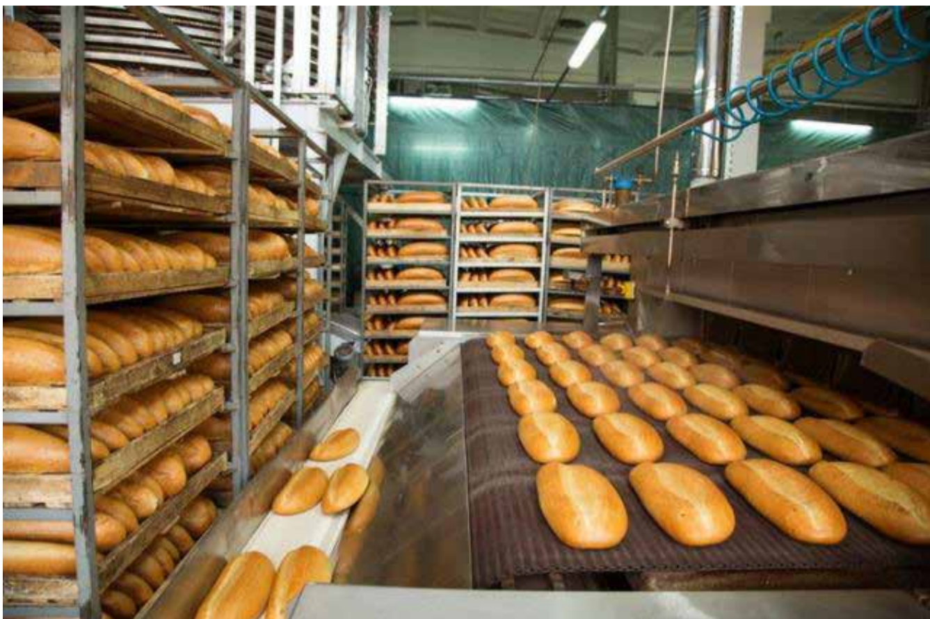
რატომ დაწესდა ფქვილზე საიმპორტო გადასახადი

მისი თქმით, ადგილობრივი ფერმერები შეძლებენ, საკუთარი ხორბალი ადეკვატურ ფასად გაყიდონ. მთლიანობაში, რეგულაციის მოქმედების დრო ანუ ხუთი თვე, ზუსტად ახალი მოსავლის მიღებამდე პერიოდია. ლევან სილაგავა ამბობს, რომ ხუთი თვის შემდეგ,