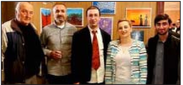
18 მაისს მუზეუმის საერთაშორისო დღე აღინიშნება...