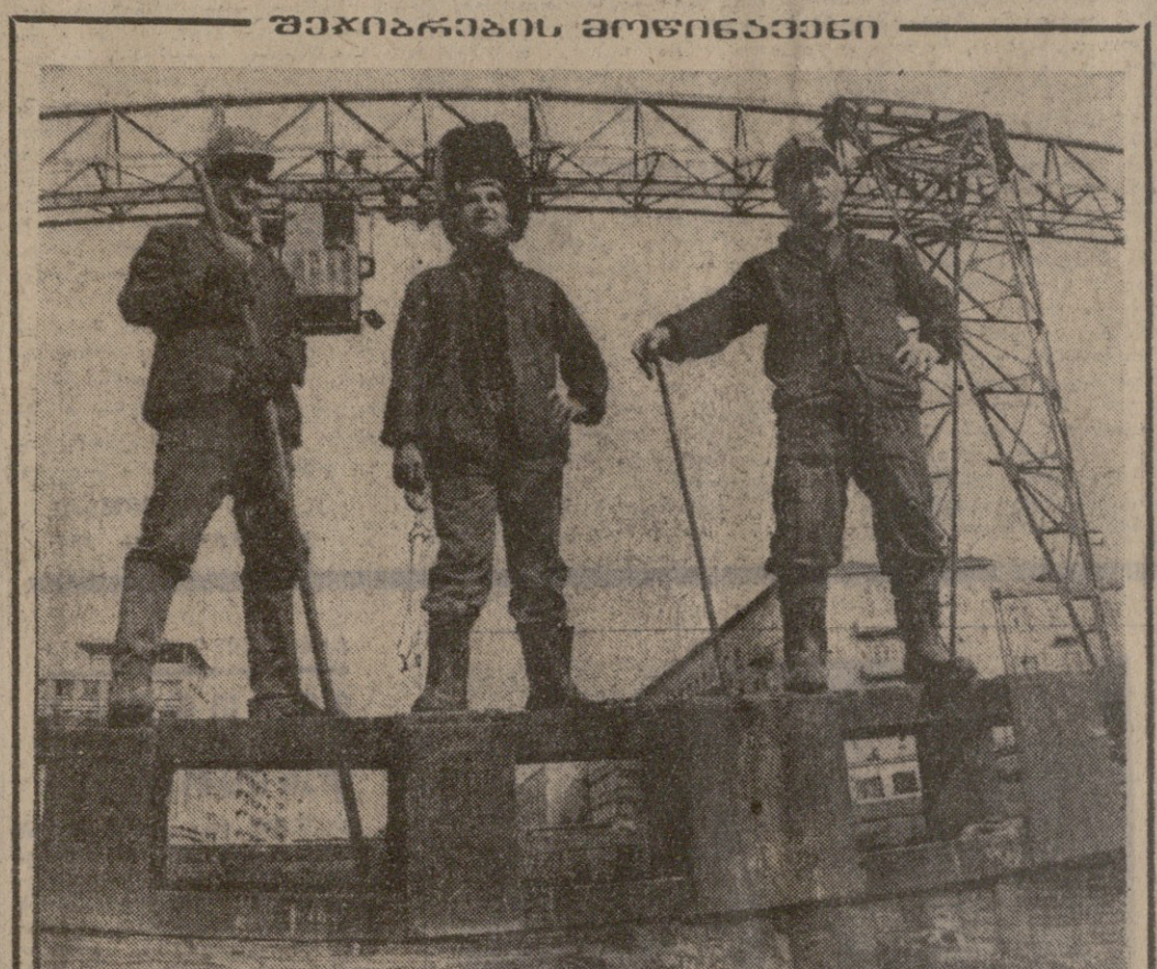
მუშაობის შედეგების დროს, გეგმებს დროს გადამატებით ასრულებს