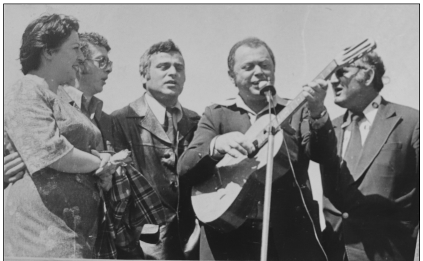
ნოვა დიმიტროვკა, 9 მაისის ზეინზე.