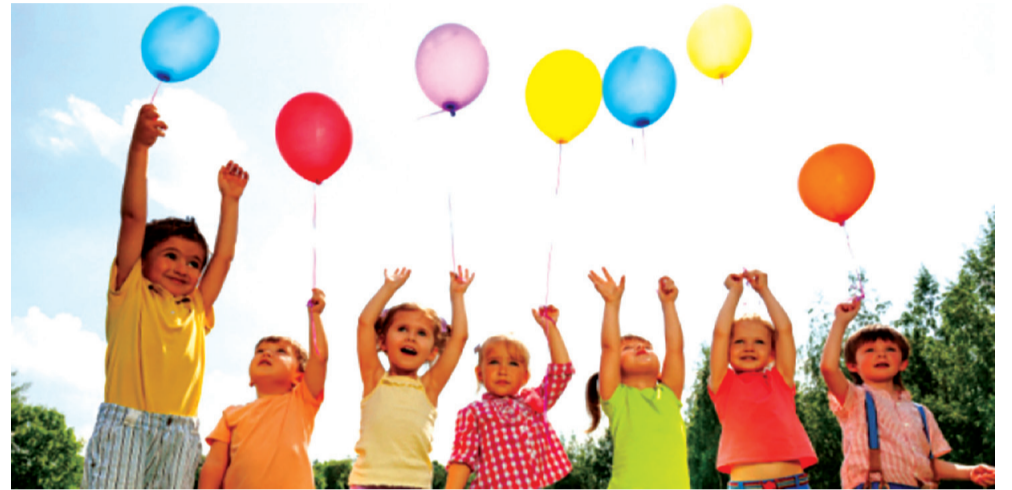
1 ივნისი ბავშვთა დაცვის საერთაშორისო დღეა

წარმოადგენდა. გამოფენაში 85 ქართული და საერთაშორისო კომპანია მონაწილეობდა. ტურიზმისა და სასტუმრო აღჭურვილობის საერთაშორისო გამოფენა კომპანია „Expo Batumi“-ის ორგანიზებით გაიმართა.