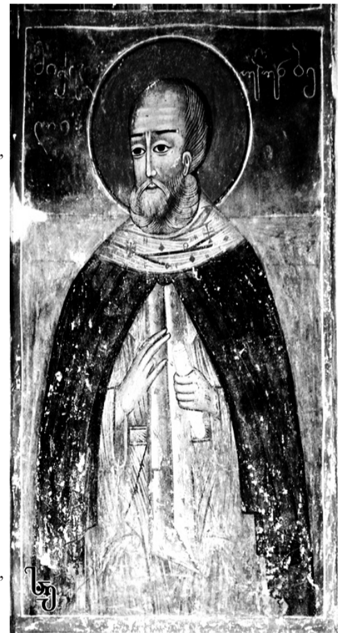
მიქაელ უღუმბოელი (ფრესკა ანანურის ეკლესიიდან)