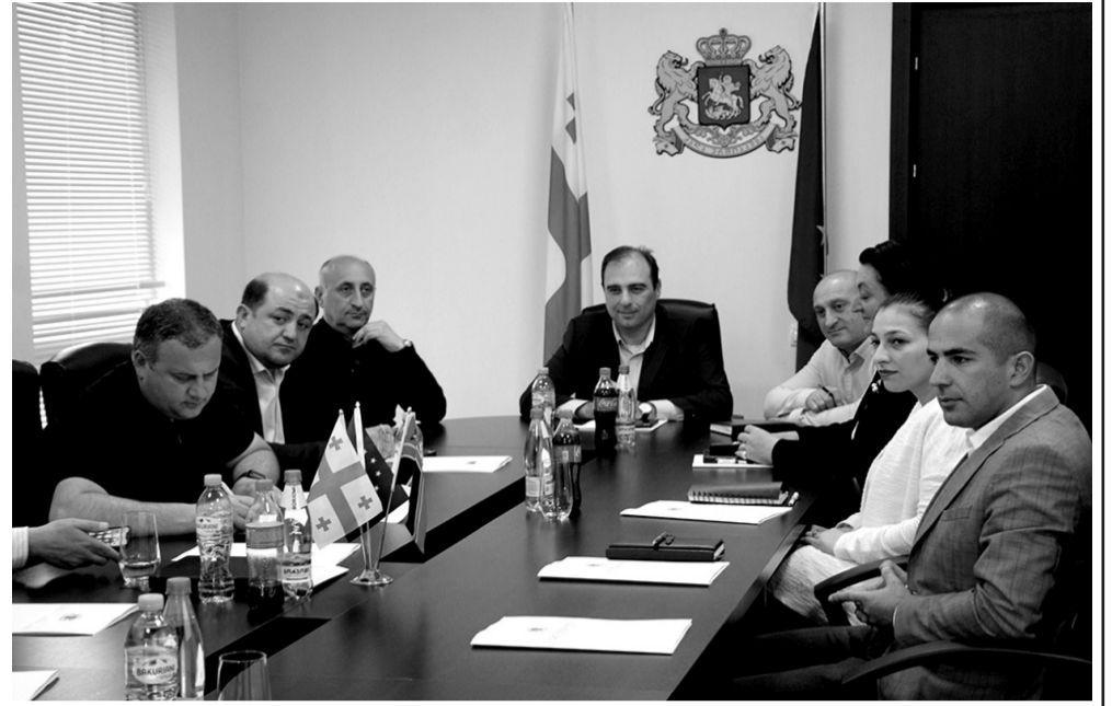
(LDN) ეროვნული მიზნების მიღწევა დეგრადირებული სამოვრების აღდგენისა და მდგრადი მართვის გზით“ ფარგლებში ჩამოყალიბებულ უწყებათშორის სამუშაო ჯგუფთან კოორდინაციით, ეროვნული და საერთაშორისო ექსპერტების მიერ. პროექტის მხარდამჭერია გლობალური გარემოს დაცვის ფონდი (GEF).

„სამოვრების მდგრადი მართვის ეროვნული პოლიტიკის კონცეფციის“ დოკუმენტი შემუშავდა პროექტის „მიწის დეგრადაციის ნეიტრალური ბალანსის