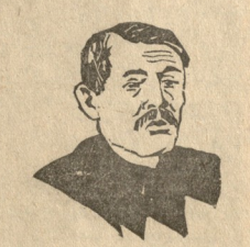
აბს. მარსელ კაჟინი. საფრანგეთის კომპარტიის ბუღალი და კომინტერნის მესამე კონგრესის წევრი.

სსრკ-ს მოსოლოდნელი რეგოლიტუციის ნე- ლი ტემპით. მაკ-მანუსის აზრით უმათერეს სა- კითხს ინგლისში შეადგენს მასიურ პროლეტარული პარტიის შექმნა. მსოფლიო კონგრესის მიზანია პრა- კტიკული წესების გამოშუშევა ყო- ველ ქვეყნებისათვის ერთიანი ფორ- მის ტაქტიკის შემოსაღებთ.