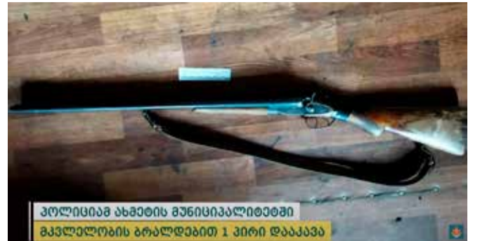
პოლიციამ ახმეტის მუნიციპალიტეტში მკვლელობის ბრალდებით 1 პირი დააკავა