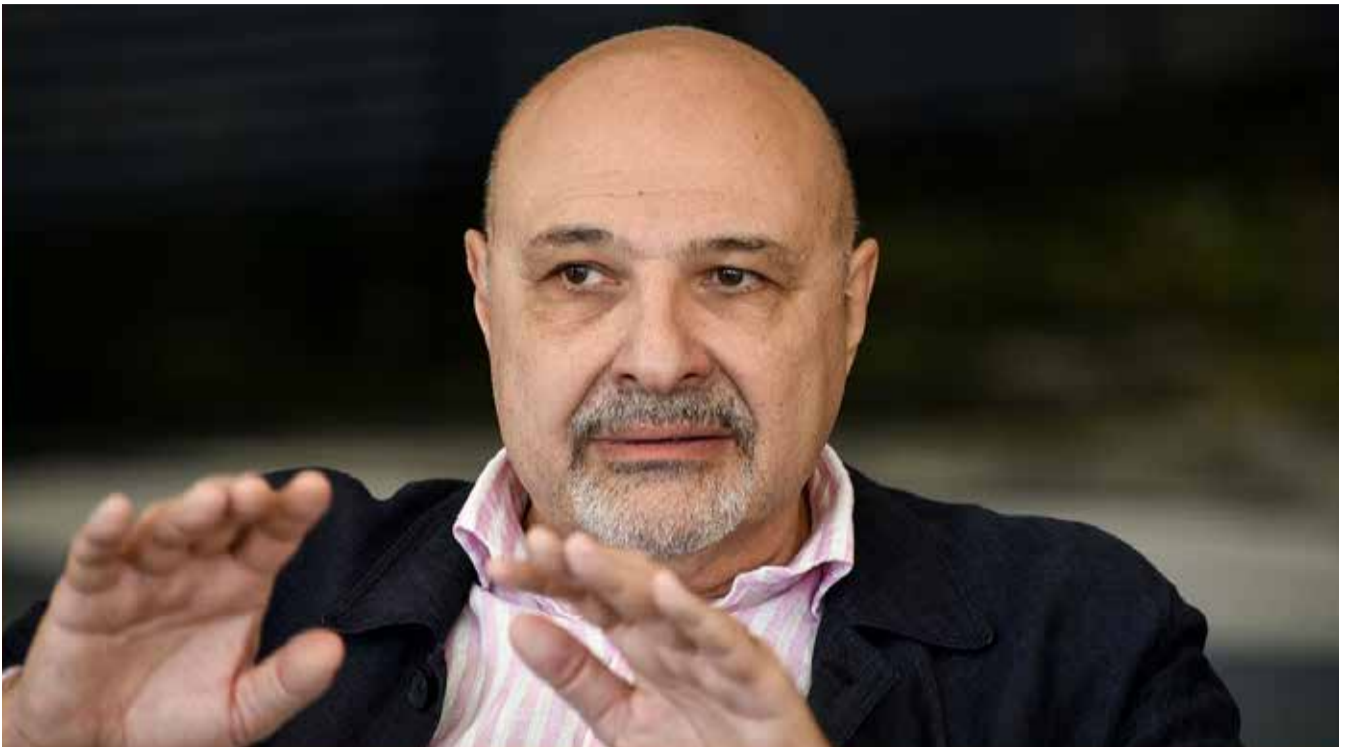
რას შეცვლის ლავროვის ამერიკული ვიზაჟი რუსეთ-უკრაინის ომში – მამუკა გამყრელიძის პროგნოზი

გაერო-ს უშიშროების საბჭოს შექმნა რას ნიშნავდა –