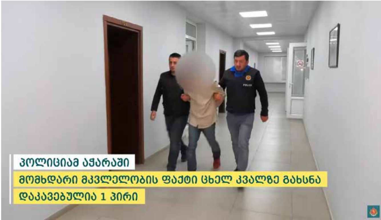
პოლიციამ აჭარაში მომხდარი მკვლელობის ფაქტი ცხელ კვალზე გახსნა დააკავებულა 1 პირი