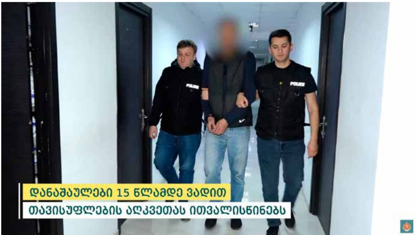
დანაშაულები 15 წლამდე ვადით თავისუფლების აღკვეთას ითვალისწინებს