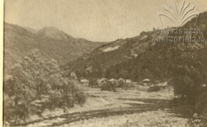
Река Лиахви. Поселок.

вом берегу реки Большая Лиахви, в северном конце селения. Здесь, у источника Дзау-Суар, построен мощный разливающий завод, продукция которого широко известна в нашей стране.