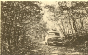
Аллея в парке санатория.