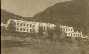
Джава. Санаторий Минздрава ГССР.