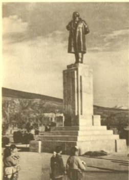
г. Сталинири. Памятник В. И. Ленина.

Своей славой Джава обязана, прежде всего, лечебным свойствам углекислой хлоридно-гидрокарбонатно-натриевой минеральной воды источника Дзау-Суар, который выходит на пра-