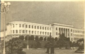
г. Сталинири. Административный дом.

тия ограждена Сурамским хребтом, отходящим от ее западной границы.