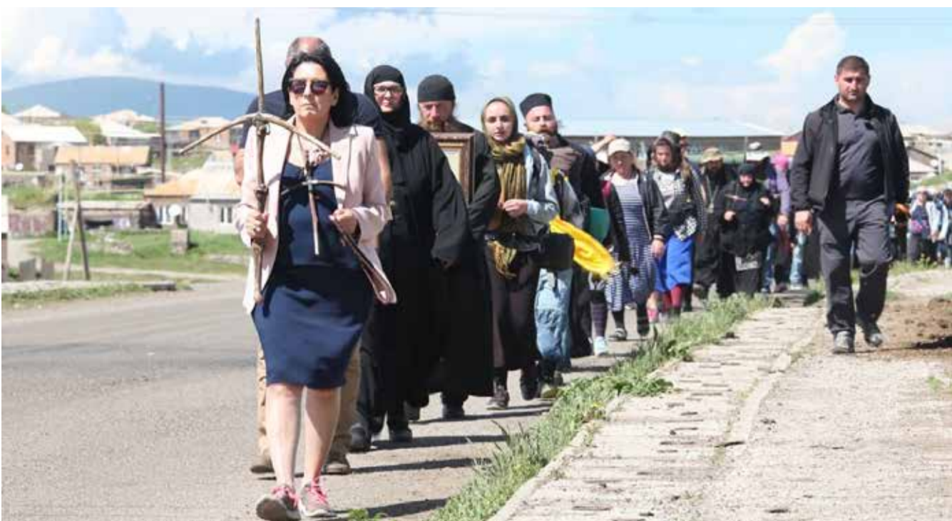
რამდენიმე სურათი ანუ ეპიზოდი მთავარსარდალის ცხოვრებიდან

2003-2004 წლებში იყო საფრანგეთის საგანგებო და სრულუფლებიანი ელჩი საქართველოში; 2004-2005 წლებში – საქართველოს საგარეო საქმეთა მინისტრი; 2005-2006 წლებში – „სალომე ზურაბიშვილის საზოგადოებრივი მოძრაობის“ ლიდერი; 2006-2010 წლებში – პოლიტიკური პარტია „საქართველოს გზის“ ლიდერი; 2006-2016 წლებში – საფრანგეთის პოლიტიკურ მეცნიერებათა ინსტიტუტის პროფესორი; 2010-2015 წლებში –