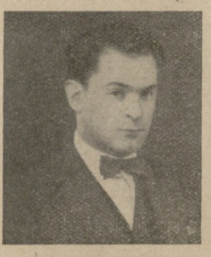
ქ. გიორგი მუსხელიშვილი