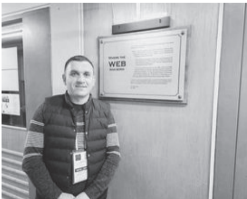
ოთახი, სადაც შეიქმნა ინტერნეტი