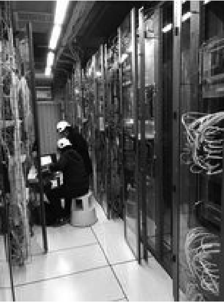
სამუშაო პროცესი CMS

- შესაძლებელია, რომ ამასაც გავდეს მათი დამოკიდებულება. ასევე ცერნში არ ამბობენ სიტყვას „მშვიდობით“. ამბობენ „ნახვამდის“. ყველას, ვინც იქიდან მოდის, ელოდებიან შემდეგ კიდევ როგორც საუბრის დასაწყისში გითხარით, გადმოგვცა ბოლოს ატესტატები, რაც იმას ნიშნავს, რომ ვართ, სიმბოლურად, რა თქმა უნდა ჩემს შემთხვევაში, ცერნის კურსდამთავრებულები, ალუმნები, ვითვლებით, რომ გვქნება კიდევ სურვილი მივიდეთ ცერნში სხვადასხვა აქტივობების განსახორციელებლად. როგორც ვითხარით, არ აქვთ პროტესტი ფოტოების გადაღებაზე, ცოდნის გაგრძელებაზე. პირიქით, მათი მიზანია, რომ რაც შეიძლება მეტი ცოდნა წაიღოს იქიდან ვიზიტორმა. მათ რომ დაემაღლათ ინტერნეტი, ელექტრონები, მიკროტალღები, ჩვენ ეს სიკეთეები არ გვქნებოდა. ამიტომ პირიქით, ამბობენ რომ მათი მიზანია, რაც შეიძლება მეტი ინფორმაცია, მეტი სიკეთე გავიდეს ცერნიდან.