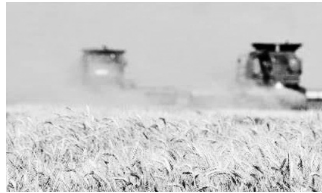
сельхоза Отар Шамугия на брифинге после заседания правительства.

"Исследование основано на информации и заявлениях, опубликованных Министерством труда, здравоохранения и социальной защиты относительно соответствия действий фармацевтических компаний антимонопольному законода-