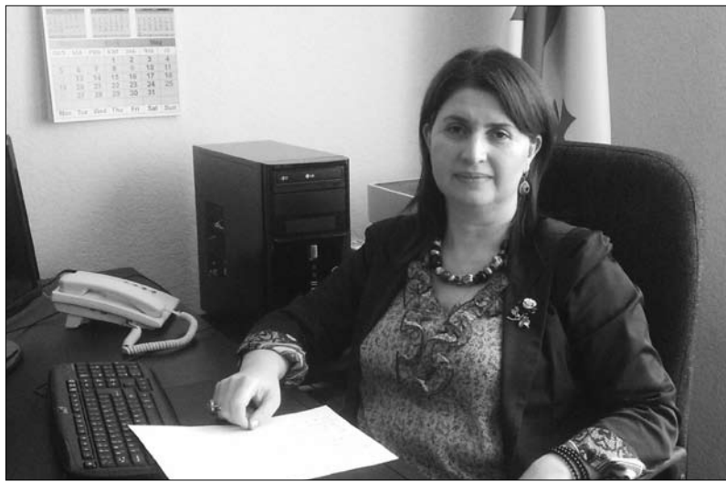
ამონაწერი მოსამართლის CV-დან