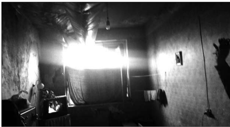
სინათლე და სალონის „ქაბრი“ დევნილების უანჯრავში