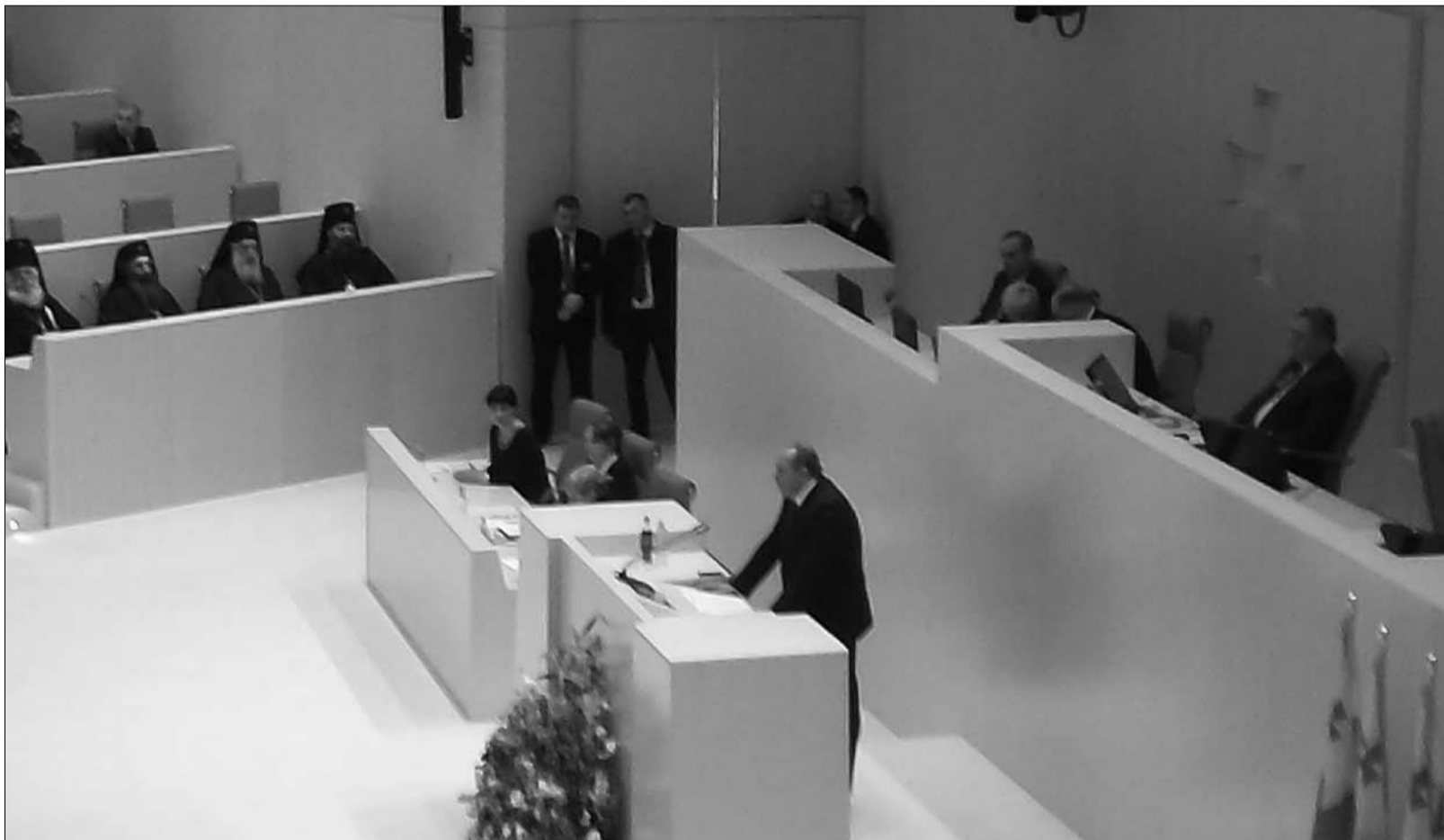
„ქვემოთ“ (ნესტან ჩაბალიძევილი) ©

საქართველოს ახალი პრეზიდენტი პარლამენტში ყოველწლიური ანგარიშით პირველად წარსდგა