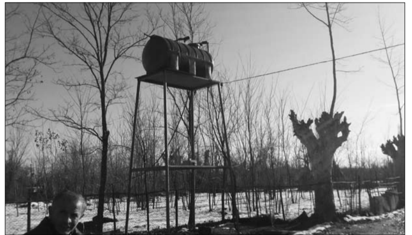
ახალი წყლის სისტემა გუბის თემში

და სკვერი, ამისთანა ეზოები გვაქვს. ახალგაზრდობისთვის! რაც ეს ტელევიზორი და ნოუთბუქები გამოიგონეს, ახალგაზრდა გარეთ აღარ გამოდის. გარეგანობა გააკეთეს, მაგრამ ჯერ არ ჩაუტარათ, ეტყობა კალაძის ჩამოსვლას ელოდებიან, რომ ჩართონ.“