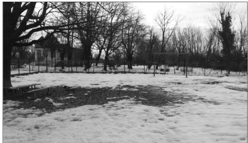
მინი სტადიონი ივანდისში