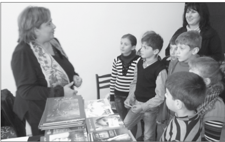
ნიგნები ორპირის სკოლისთვის

ქუთაისში მდებარე დევნილთა სკოლაში, ბავშვთა სოფელში და რამდენიმე მცირე-კონტინენტური სკოლაში.