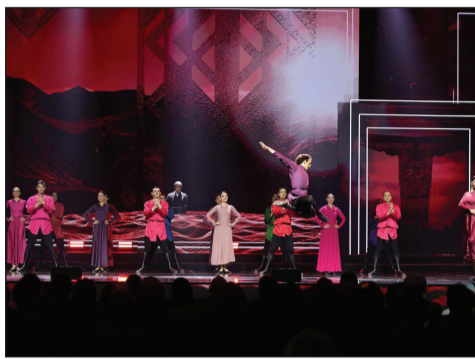
ტივად გასდევს მთელ ჩვენს ისტორიას – ქართულ სტუმართმოყვარეობას.

ისინი, ვინც უკვე ყოფილან საქართველოში – იცნობენ ამ ფენომენს და იცნავენ, რომ ქართული სტუმართმოყვარეობა – მართლაც უსაზღვროა.