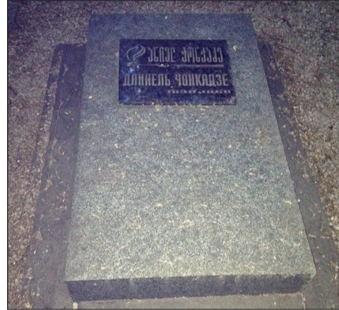
ვერის ბაღში მდებარე საფლავი

დანიელის მდგომარეობა თანდათან უიმედო გახდა, რაც, ცხადია, ყველაზე უკეთ თვითონ იგრძნო. 1859 წლის 6 აპრილს მან შეადგინა ანდერძი. ეს არის ნიმუში, თუ როგორ უნდა წერდეს ანდერძის ნამდვილი ქრისტიანი. აქ ჩანს კეთილშობილური ბუნება მწერლისა, რომელიც გულწრფელად ითხოვს შენდობას მოკეთებულ განაშთავს, განმტკიცებულია მომავალი საუკუნო ცხოვრების რწმენით. მოგვყავს ანდერძის ქართულად ნათარგმნი ტექსტი, რადგანაც ის მწერალს რუსულად შეუდგებოდა.