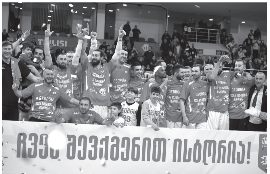
ჩვენს გუნდში ისტორია!

სპორტი სპორტია. გამარჯვება — გამარჯვება. დამარცხება — დამარცხება. მაგრამ თურმე ხდება, რომ გამარჯვება დამარცხებაა, დამარცხება შეიძლება გამარჯვებას ნიშნავდეს, ხოლო სპორტი ყოველთვის არ არის მხოლოდ სპორტი. სწორედ ასე მოხდა 2023 წლის 26 თებერვლის ისტორიულ დღეს თბილისში, როცა კალათბურთელთა წლებანდელი მსოფლიო ჩემპიონატის შესარჩევი ტურნირის ბოლო მატჩში ერთმანეთს საქართველოსა და ისლანდიის ნაკრები გუნდები დაუპირისპირდნენ. ექვსგუნდიან ქვეჯგუფში ამ დღისათვის საქმე ისე აენყო, რომ ესპანეთმა და იტალიამ ფინალის საგზურები მშვიდად გაინაღდეს, უკრაინამ და ნიდერლანდმა ყველა შანსი