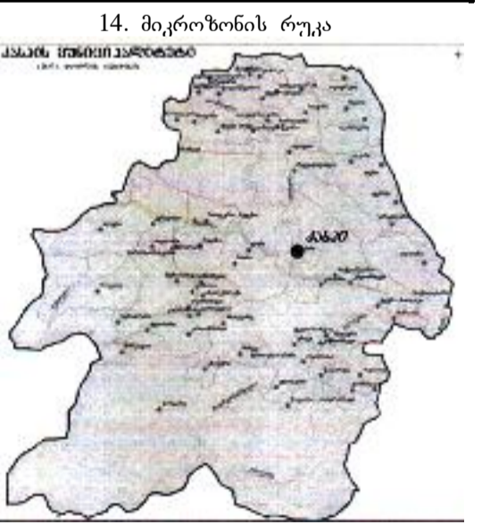
14. მიკროზონის რუკა

13. წარმოების საკონტროლებელი ორგანო წარმოების სპეციფიკაციის დაცვასა და ადგილწარმოშობის დასახელების მართებულად გამოყენებაზე სახელმწიფო კონტროლს ახორციელებს სსიპ -ღვინის ეროვნული სააგენტო.