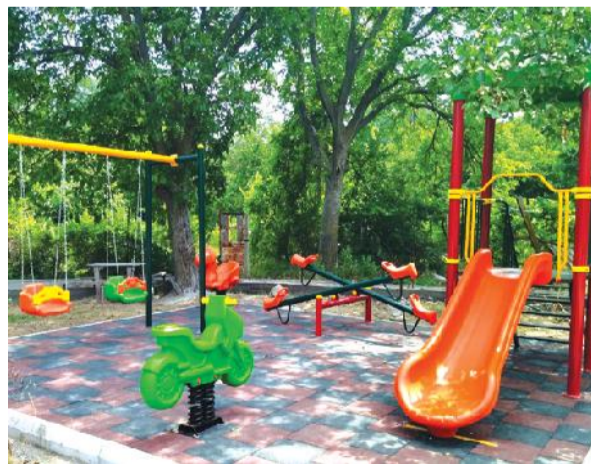
„სოფლის მხარდაჭერის პროგრამის“ ფარგლებში, ლეებში დღემდე არ ყოფილა.

4 სახეობის გასართობი საშუალებების შექმნა - მოწყობაზე ოთხივე სოფელში 56 895 ლარი დაიხარჯა, რომელიც ელექტრონულ ტენდერში გამარჯვებული შპს „ექსი მმედი“-მ განახორციელა. 2022 წლის