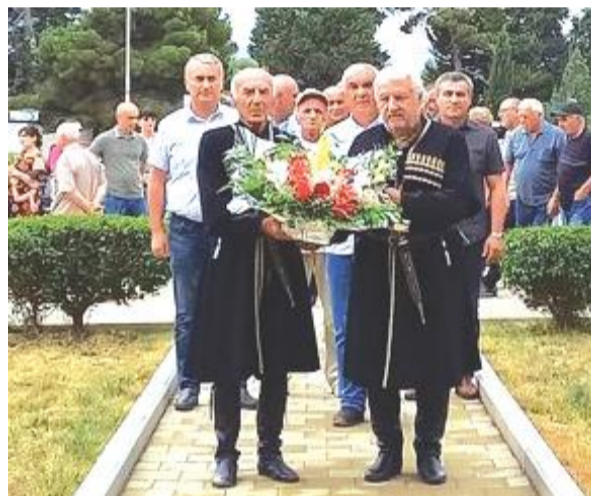
სამინისტროს 14 თანამშრომელი და 224 სამოქალაქო პირი დაიღუპა.