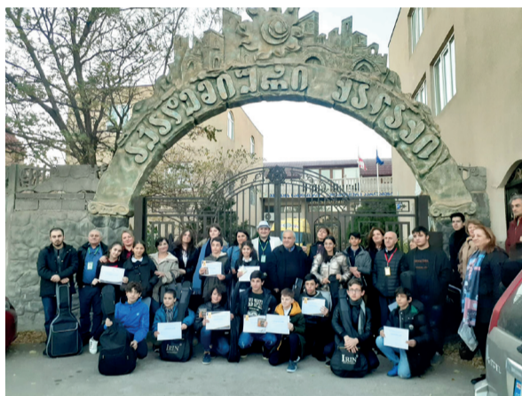
ჭით დაჯილდოებული ახალგაზრდები მონაწილეობდნენ, პირველი დღე სემინარულ მუშაობას დაეთმო, ხოლო მეორე დღეს, ფესტივალის ფარგლებში კლასიკური გიტარის

ორ დღეს მიმდინარეობდა რუსთავის აკადემიურ ქალაქში, სამ ლოკაციაზე ერთდროულად გაშლილ სივრცეში, კლასიკური გიტარის საერთაშორისო ფესტივალი, რომელიც სწორედ აკადემიური ქალაქის მხარდაჭერითა და სტუდია "მომავალი ჩვენია", ნიჭიერი ახალგაზრდების ინტერესთა დამცველი საერთაშორისო ასოციაციის ინიციატივით ჩატარდა, საყოველთაოდ ცნობილი ვირტუოზი გიტარისტის ტარიელ სუარის ხელმძღვანელობით, რომელშიც საქართველოს სხვადასხვა ადმინისტრაციული ცენტრებიდან, კლასიკური გიტარის მოტრფიალე, შემოქმედებითი ნი-