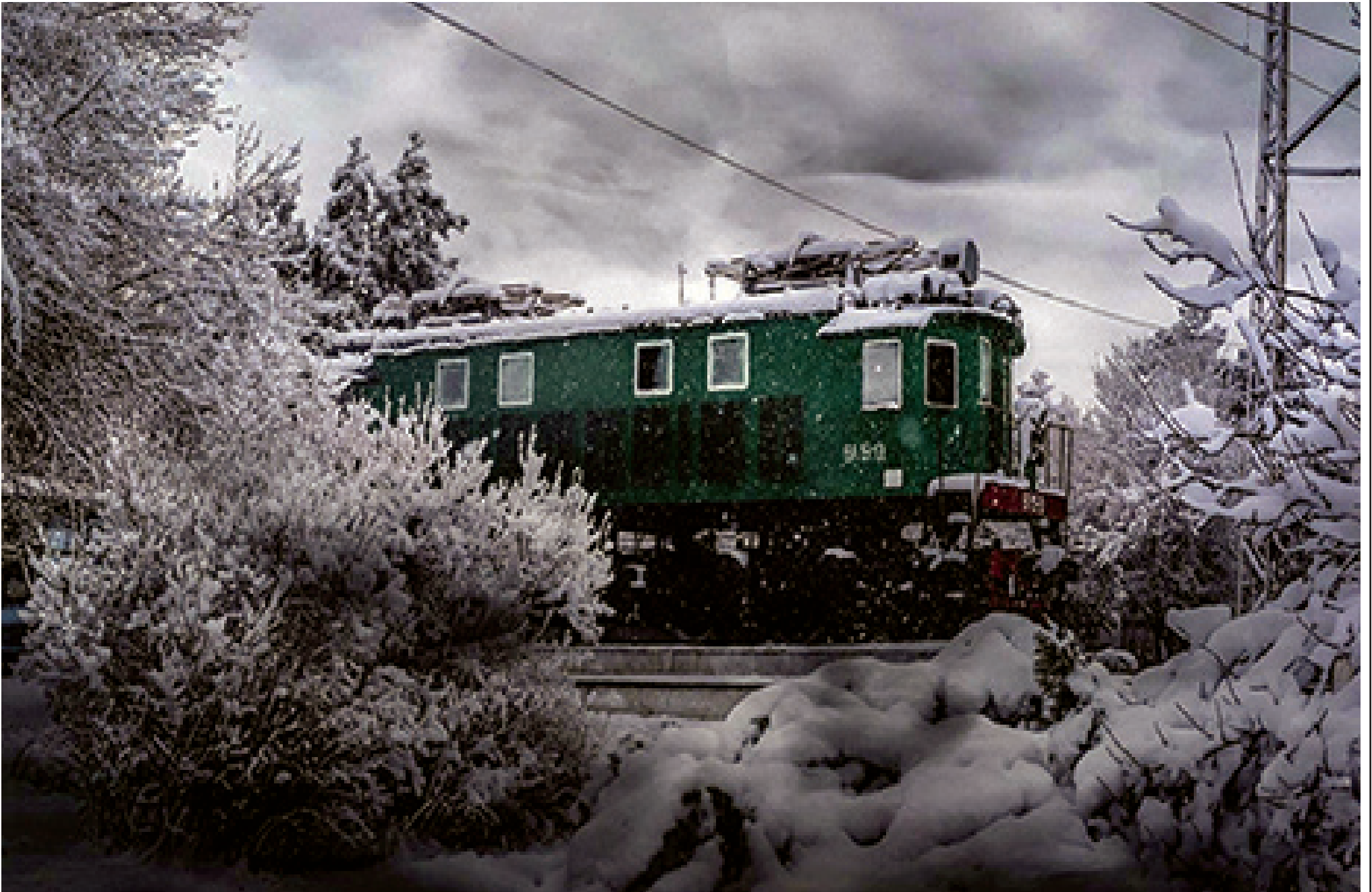
ჩვენში ქალაქის ცენტრში მდებარე ეს სამუზეუმო ექსპონატი - პირველი ისტორიული ელმავალი, სულ ჩქარა, საუკუნის გახდება. და ვიდრე დიდ იუბილეს იხეიმებს, ხშირადაა ასე „ფიჭრებში“ და ამ ზამთრის დღეებში ალბათ თავის დიდ წარსულს და ახალგაზრდობას იხსენებს.