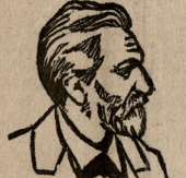
აპრილის 12-ის ბათუმის კომიტეტის წევრი

გერმანიის კრიზისი დალი დასრულდა და უკიდურეს კრიზისში გადავიდა. გერმანიის კრიზისი დალი დასრულდა და უკიდურეს კრიზისში გადავიდა.