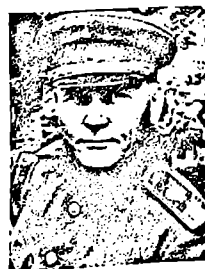
ივანე სტეფანეს ძე კონევი (1897-1973). მხედართმთავარი, საბჭოთა კავშირის მარშალი.

დაიბადა გულისის ოჯახში. 1934 წელს დაამთავრა მ. ფრუნზეს სახ. სამხედრო აკადემია. მონაწილეობდა პირველ მსოფლიო ომში. უნტერ-ოფიცერი. 1918 წელს შევიდა ნითელ არმიში. იბრძოდა სამოქალაქო ომის ფრონტებზე, მონაწილეობდა კრონშტადტის აბოუხების ჩახშობაში (1921 წ.).