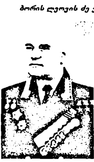
ბორის ლეოვის ძე ვანნიკოვი (1897-1962). გენერალ-პოლკოვნიკი. დიპლომა მუშაოჯანში. 1918 წელს დაამთავრა ბაქოს პოლიტექნიკური სასწავლებელი, ხოლო 1926 წელს -- მოსკოვის უმაღლესი ტექნიკური სასწავლებელი. 1933 წელს დაინიშნა ტულის იარაღის ქარხნის დირექტორად, 1936 წელს -- საბჭოთა კავშირის თავდაცვითი მრეწველობის სახალხო კომისარიატის საარტელური-სატანკო მთავარი სამმართველოს, 1937 წელს -- სატანკო მთავარი სამმართველოს უფროსად, 1939 წელს -- საბჭოთა კავშირის შეიარაღების სახალხო კომისარად. 1941 წლის 7 ივნისს დააპატიმრეს და ორი დღის შემდეგ გაათავისუფლეს სახალხო კომისარის თანამდებობიდან. ბოლო მომენტში ი. სტალინმა მისი სიკვდილი დასჯა გადართვარა და 1941 წლის 25 ივლისს პატიმრობიდან გაათავისუფლეს. 1941 წლის აგვისტოდან იყო შეიარაღების სახალხო კომისარის მოადგილე, 1942 წლის თებერვლიდან -- სამარშოლო საქურვლის სახალხო კომისარი, 1946 წლის იანვრიდან -- სოფლის მეურნეობის მანქანათმშენებლობის მინისტრი. იმავე წელს მინისტრობიდან გაათავისუფლეს. 1958 წელს პენსიაზე გადავიდა.

1942 წლიდან იყო საბჭოთა კავშირის მეცნიერებათა აკადემიის სამხედრო და საზღვაო საქმეთა სამეცნიერო-ტექნიკური საკითხთა კომისიის წევრი. მდივანი, ფიზიკურ-ტექნიკურ ინსტიტუტში ხელმძღვანელობდა სატანკო ჯავშნის ლაბორატორიას. 1943 წელს დააარსა და გახდა ატომური ენერჯის ინსტიტუტის პირველი დირექტორი. სიცოცხლის ბოლომდე ხელმძღვანელობდა სამხედრო მიზნებისათვის ატომური ენერჯის გამოყენების პროექტებს. 1949 წელს მისი ხელმძღვანელობით საბჭოთა მეცნიერება შექმნეს ატომური ბომბი.