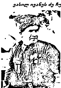
ვასილ ივანეს ძე ჩუიკოვი (1900-1892). საბჭოთა კავშირის მარშალი. დაბადა გლეხის ოჯახში. 1925 წელს დაამთავრა სამხედრო აკადემია, 1927 წელს მ. ფრუნზეს სახ. სამხედრო აკადემიის აღმოსავლეთის ფაკულტეტი, 1936 წელს — ნიჟელი არმიის მექანიზაციის და მოტორიზაციის აკადემიური კურსები. 1919 წელს შევიდა ნიჟელი არმიით, იბრძოდა სამოქალაქო ომის ფრონტებზე. 1918 წელს მონაწილეობდა

სტალინგრადის დაცვის მთელი სიძიმე თავიანთ მხრებზე იწევიეს იმ არმიების ჯარისკაცებმა და ოფიცრებმა, რომელთაც სარდლობდნენ გენერალი ვ. კოლპაკი, ა. ლოპატინი, ვ. ჩუიკოვი და მ. შუმილოვი.