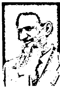
იგორ ვანნიკის ძე კურჩატოვი (1902-1960).