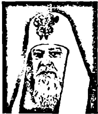
ალექსი — მოსკოვისა და სრულიად რუსეთის პატრიარქი, ერისკაცობაში სერგი სიმანსკი (1877-1970). დამაბა მუშაშლის ოჯახში. განათლება მიიღო მოსკოვის უნივერსიტეტის იურიდიულ ფაკულტეტზე და მოსკოვის სასულიერო აკადემიაში. სხვადასხვა დროს იყო ტულიისა და ნოვგოროდის სასულიერო სემინარიების რექტორი, ტიხვინისა და ნოვგო-

როდის ეპისკოპოსი, მონასტრის წინამძღვარი. 1921 წლიდან იყო იამბურვის, პეტერბურგის, ტიხვინის, ნოვგოროდის ეპისკოპოსი. 1927 წელს გახდა რუსეთის მართლმადიდებელი ეკლესიის უწმინდესი სინოდის წევრი. 1927 წელს ხელი მოაწერა მიტროპოლიტ სერგის მიერ შედგენილ დეკლარაციას. 1933 წლიდან იყო ლენინგრადის ეპისკოპოსი, ბლოკადის წლებში ქალაქი არ დაუტოვებია. 1944 წლიდან იყო პატრიარქის ტახტის მონაცვლე. 1945 წელს აირჩიეს მოსკოვისა და სრულიად რუსეთის პატრიარქად.