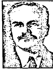
ვიჩინსკი მიხეილის ძე მოლოტოვის (1890-1986)

ნაშენილი გვარია სკრიპინი. გამორჩეული სახელმწიფო მოღვაწე. დაიბადა ნერლი მოხელის ოჯახში. დაათარგა ყაზანის რეალური სასწავლებელი, სწავლობდა პეტერბურგის პოლიტექნიკურ უნივერსიტეტში, რომელიც არ დაუმთავრებია. 1906 წელს შეუდგა რსდმპ რიგებში, მოლშევიკი 1909 წელს რევოლუციური მოღვაწეობისათვის დააპატიმრეს და ვოლოგდაში გადაასახლეს. 1911 წელს გადასახლებიდან დაბრუნდა და პარტიული მუშაობა განაგრძო. 1915 წელს ისევ დააპატიმრეს და ციხეში გადასახლეს, 1916 წელს გადასახლებიდან გაიქცა. იყო 1917 წლის თებერვალ-მარტის რევოლუციის მონაწილე. 1917 წლის ოქტომბრიდან მუშაობდა სხვადასხვა პარტიულ და სახელმწიფო თანამდებობებზე. 1921-1930 წლებში იყო რკპ(ბ) - სკპ(ბ) ცენტრალური კომიტეტის მდიანი და ცენტრალური კომიტეტის საორგანიზაციო ბიუროს წევრი. ამ პერიოდში დაუახლოვდა ი. სტალინს.