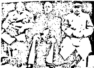
იოსებ სტალინი, ფრანკლინ რუზეველტი და უინსტონ ჩერჩილი

იალტის კონფერენციაზე ხელმოწერილი იქნა საიდუმლო შეთანხმება. შეთანხმების ძალით, გერმანიის კაპიტულაციიდან ორი-სამი თვის შემდეგ საბჭოთა კავშირი იაპონიის წინააღმდეგ ომში უნდა ჩაბმულიყო. შეთანხმების ეს პუნქტი ძალზე ახარებდა ფრანკლინ რუზეველტს, რადგან, მისი აზრით, გერმანიის კაპიტულაციის შემდეგ იაპონიის წინააღმდეგ ომის დაწყება მხოლოდ ექვსი თვის შემდეგ თუ გახდებოდა შესაძლებელი. იოსებ სტალინმა ამ დათმობის ფასად მოითხოვა: რუსეთ-იაპონიის ომის შემდეგ იაპონიის მიერ მიტაცებული კუნძულ სახალინის სამხრეთ ნაწილისა და მიმდებარე კუნძულების საბჭოთა კავშირისათვის დაბრუნება, საბჭოთა კავშირისათვის პორტ-არტურის იჯარით გადაცემა იქ სამხედრო-საზღვაო ბაზის განლაგების უფლებით, აღმოსავლეთ ჩინეთის რკინიგზის გადასვლა ჩინეთისა და საბჭოთა კავშირის ერთობლივ ექსპლატაციაში, კურილიის კუნძულების საბჭოთა კავშირისათვის გადაცემა. ფრანკლინ რუზეველტი და უინსტონ ჩერჩილი იოსებ სტალინის წინადადებას დასთანხმდნენ.