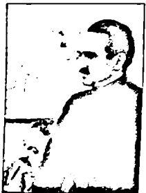
ანანტას ივანეს ძე მიქოიანი (1885-1978).

სახელმწიფო მოღვაწე. დამიბდა დურდლის ოჯახში. 1916 წელს დაამთერა თბილისის სომხური სასულიერო სემინარია, სწავლობდა ემზაძინის სასულიერო აკადემიაში. 1915 წელს შევიდა რსდმპ რიგებში, ბოლშევიკი. 1917 წლიდან ბოლშევიკური პარტიის დავალებით მუშაობდა თბილისსა და ბაქოში. 1918 წლის მარტში მონაწილეობდა მიიღო ბაქოში დაუბეულ მუსკავტელთა აჯანყების ჩახშობაში. ბაქოს