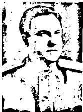
ვიქტორ სიმონის ძე აბაკუშვილი (1908-1954).

სახელმწიფო უშიშროების ორგანოების ერთ-ერთი ხელმძღვანელი, გენერალ-პოლკოვნიკი. დაიბადა მეცეცხლურის ოჯახში. ვანათლება მიიღო ოთხკლასიან საკლასო სასწავლებელში. მუშაობდა სანიტრად, კომპრატივის მუშად, საწყობის მუშად. 1932 წლიდან საბჭოთა კავშირის გაერთიანებული სახელმწიფო პოლიტიკური სამმართველოს სისტემაში, 1937-1938 წლებში საბჭოთა კავშირის შინაგან საქმეთა სახალხო კომისარიატის სახელმწიფო უშიშროების მთავარი სამმართველოს ოპერატიული რმუნებელია. 1938 წლიდან შინაგან