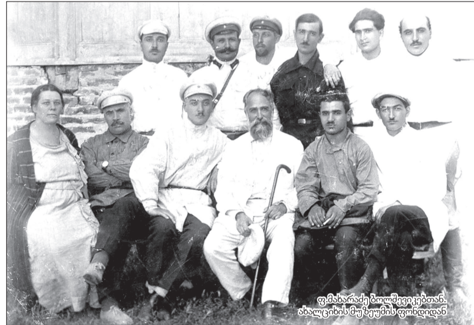
ფ. მახარაძე ბოლშევიკებთან. ახალციხის მუზეუმის ფონდიდან

განაჩენი: თავი ჩამოიხრჩო. ოფიციალური ცნობით, სერგო ორჯონიკიძე გულის დაავადებით გარდაიცვალა. მოგვიანებით გაჩნდა ვერსია იმის თაობაზე, რომ ის აიძულეს, თავი მოეკლა. მესამე ვერსიით სერგო ორჯონიკიძე კევამი ნასროლი ტყვიით გარდაიცვალა საკუთარ ბინაში. ის მოსკოვში, ნიოელ მოედანზე კრემლის კედელთან დაკრალეს. ოფიციალური ცნობით ფილიპე მახარაძე ბუნებრივი სიკვდილით გარდაიცვალა. თუმცა მოგვიანებით გახდა ცნობილი, რომ მან თავი ჩამოიხრჩო.