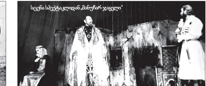
სცენა სპექტაკლიდან „მანუჩარ ჯვაცილი“