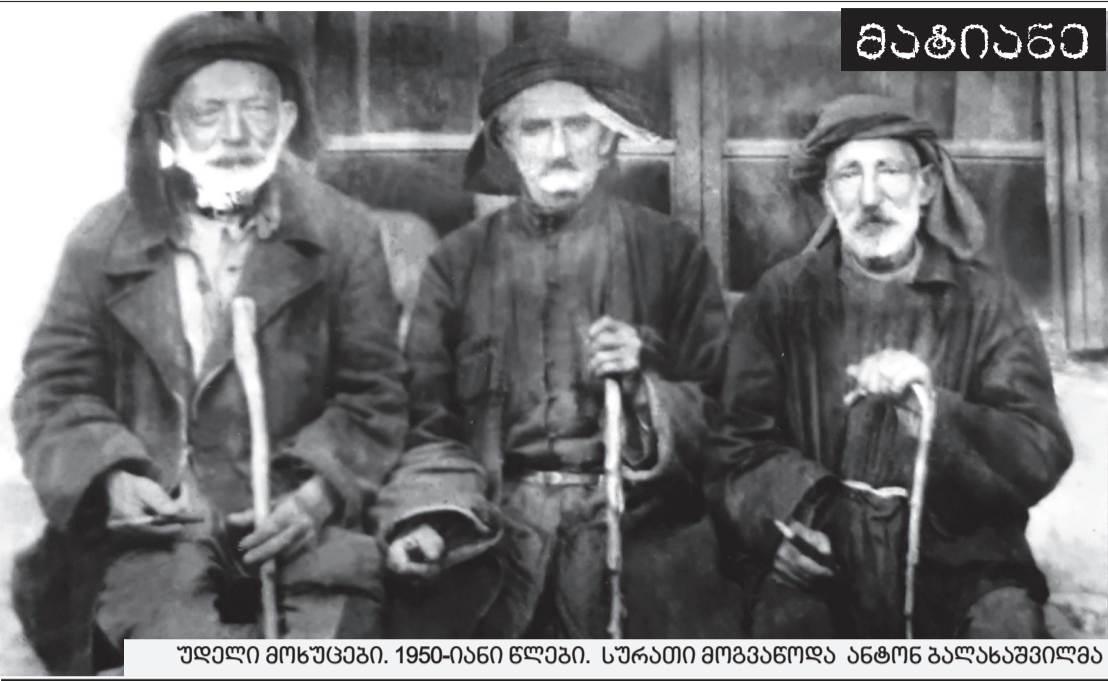
უძველი მოსუცევი. 1950-იანი წლები.