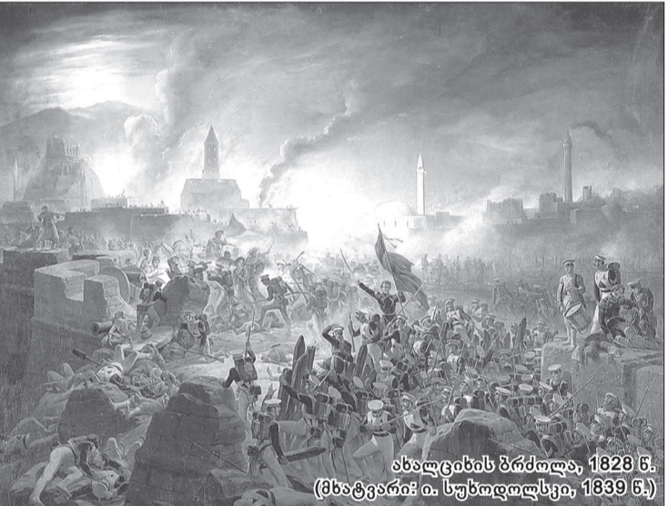
ახალციხის ბრძოლა, 1828 წ. (ნახატავს: ი. სუბოდოლსკი, 1839 წ.)

გომელში მდებარე რუმინანცევის სასახლე ფელდმარშალმა პასკევიჩმა 1834 წელს 4 მილიონ რუბლად შეიძინა. ნიკოლოზ I-მას 1838 წელს უბოძა გომელის მამულის დარჩენილი ნაწილი. ახალი მფლობელის გრანდიოზული იდეების განსახორციელებლად ვარ-