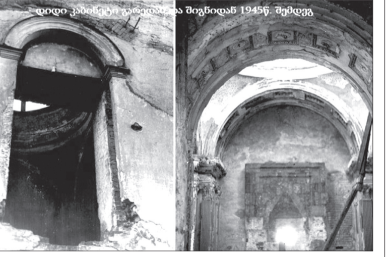
დიდი კაბინეტი გაიღო, რა შენიშნა 1945 წ. შემდეგ

დიდი ყურადღება დაეთმო პასკევიჩის ყოფილი სასახლის აღდგენას. 1959 წელს აქ პიონერთა სასახ-