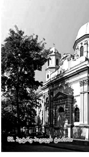
მმ. პეტრე-შავლეს ტაძარი