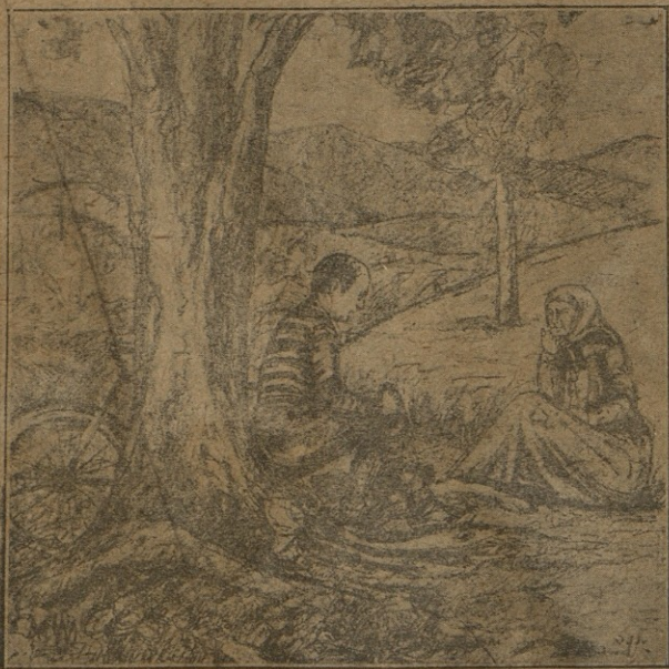
დასურათბატება მხატვ. ალ. ციმაკურიძისა.

დედაბერმა ერთი მუჟა ბურნუთი ხელის გულზე წამოიყარა, დააწაფა მსხვილ ცხვირს და ერთი ყნოსვით შეისუნთქა. მიისრის მოისრისა ცხვირის ნესტოებზე, შეიმშრალა ცრემლები და შემომხედა