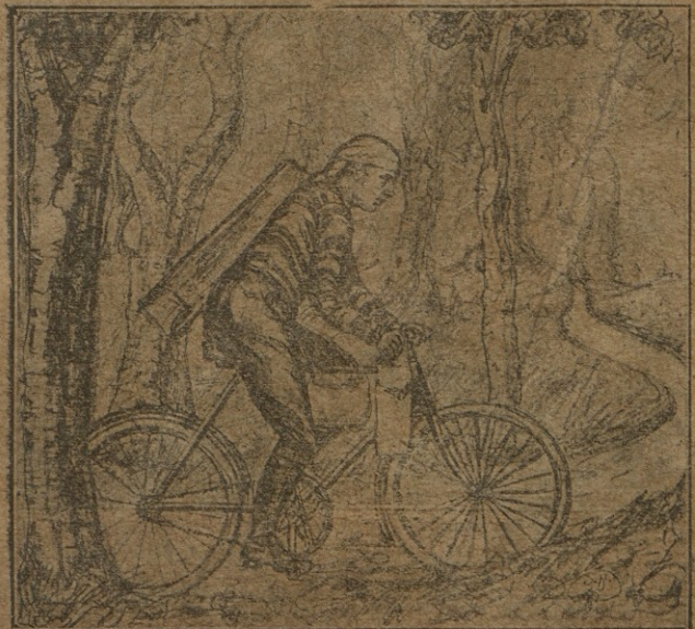
დასურათხატება მხატვ. ალ. ციმაკურიძისა.

თელავის მე წინად ხშირი სტუმარი ვეყოფილვარ: მიზიდავს მისი ცივი და კამკამა წყაროები, მიზიდავს ნახი, ფერ მიმკრთალი მისი ბუნება, მიზიდავს მეგობარი, რომელთანაც მუდამ ჩამოვხტები ხოლმე, — მეგობარს უამბობ ჩემ გულის დარდებს, — ის მანუგეშებს, მამნევენებს და მიაღერებს.