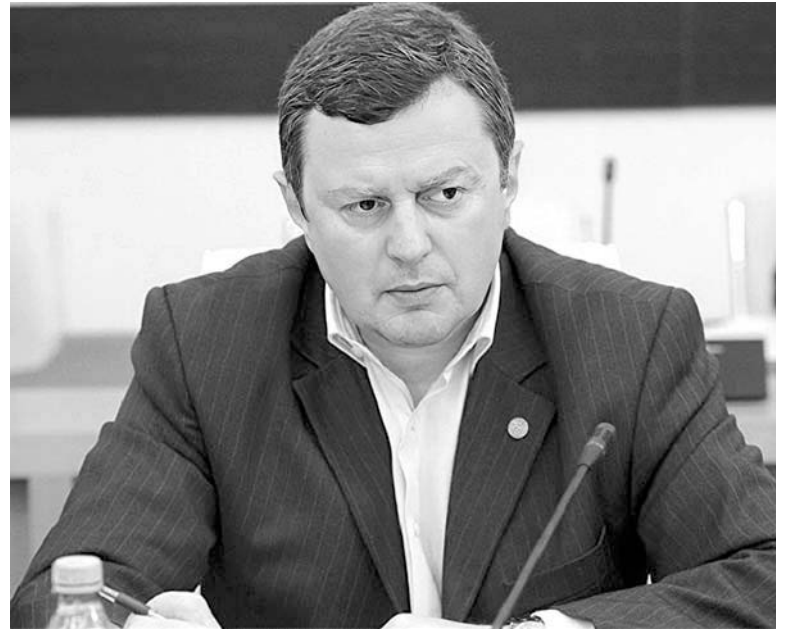
დემოკრატია ცოცხალი აღარ არისო.

— ომის დაწყებიდან ერთ თვეში უკრაინამ საქართველოდან ელჩი გაიწვია. ახლა, როგორც