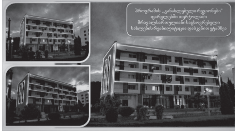
პროგრამის „განახლებული რეგიონები“ ფარგლებში თერჯოლაში მრავალსართულიანი საცხოვრებელი სახლების რეაბილიტაცია დასკვნით ეტაპზეა

პროგრამის დასრულების შემდეგ განახლება ცენტრალური ქუჩები, რეაბილიტირდება და მოეწყობა ახალი სკვერები და სხვა მუნიციპალური ინფრასტრუქტურა. ახალი პროექტების შედეგად განახლებული ურბანული მდებარეობები ახალ შესაძლებლობებს გაუჩენს ადგილობრივ მოსახლეობას.