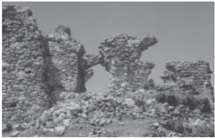
„არს მთის კალთას, სკანდას, სასახლე მეფეთა და ციხე დიდი, დიდშენი“ პანუშტი ბაბრატიონი