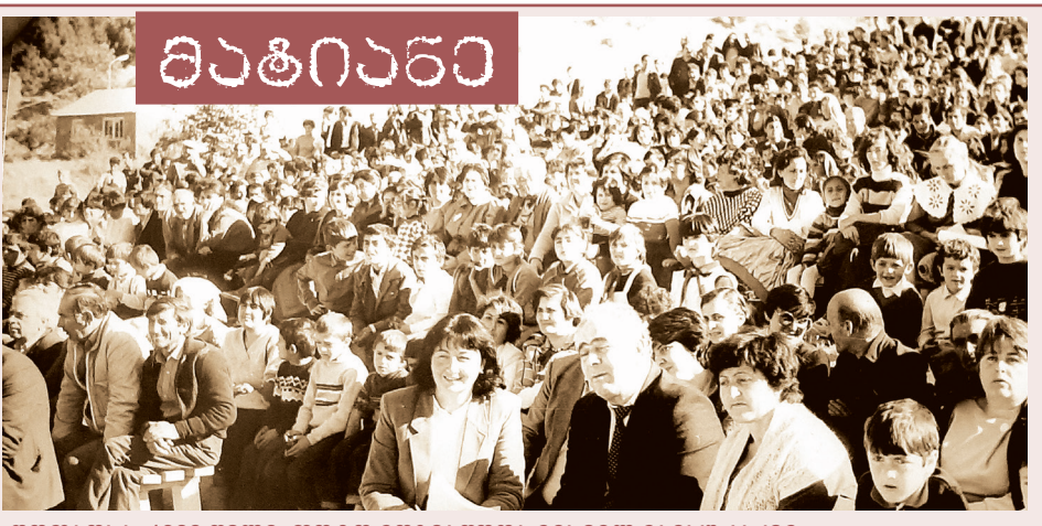
შოთაოვა. 1988 წელი.