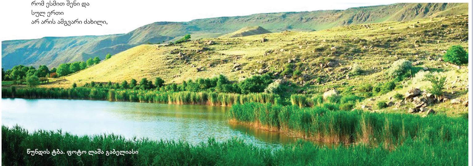
წუნდის ტბა.

„2 Pac“-ი იმარჯვებს ამ ომში, „Bad Guy“-ს ხედვები გამართლდა. „Опасные Блондинка“ აღმოეჩნდი, არა!!! „Козырная Дама“ ხარ. თამაში კარგად არ გცოდნია, მთავარი ფიქრია თამაში. „VaLeT“-ი ეძებო ჯობია, გახსოვდეს..! „JokeR“-თან დამარცხდი..!