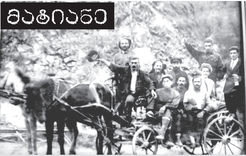
აბასთუმანი. 1937 წელი.