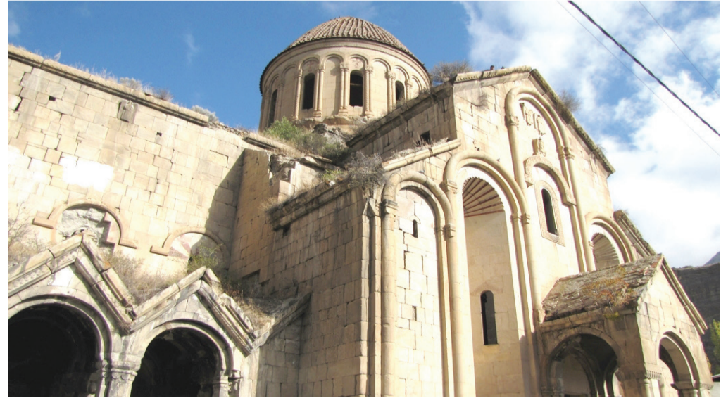
მინდა, მივეახლო შატბერდს და არტანუჯს, ქართული გალობა ვისმინო ბანაში.

ისევ ჩამთვლიმა, ჩამეძინა, მოდის ზამთარი, ისევ მომესმის შორეული, შენი ხმა ლბილი, ო, ეს ფიქრები უცაბედი და მინავლული... ბილიკთან ვდგავარ, გითვალთვალავ, – როდის ჩაივლი... ისევ შრიალებს მხრებგაშლილი ტყემლის ძველი ხე, ასე მგონია, გუშინ ვითხარ ჩემი სათქმელი, ვერ დავივიწყე ის დღე, როცა ხელი შევახე,