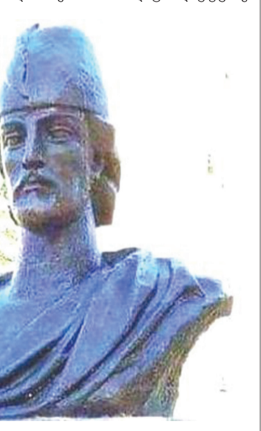
რუსთაველის ძეგლი ისრაელში

რუსთაველიც. დაისვა პოეტის სახელის უკვდავყოფის საკითხი. 1893 წლის ივნისში გაზეთმა „ივერია“ გამოაქვეყნა ალექსანდრე ხახანაშვილის წერილი, რომელშიც ნამოჭრილია თბილისში შოთა რუსთაველის ძეგლის აგების წინადადება. პუბლიკაციაში სახელდობრ, ნათქვამია: დროა შევადგინოთ კომისია ძეგლისათვის საჭირო თანხის შესაგროვებლად, მით უფრო, რომ