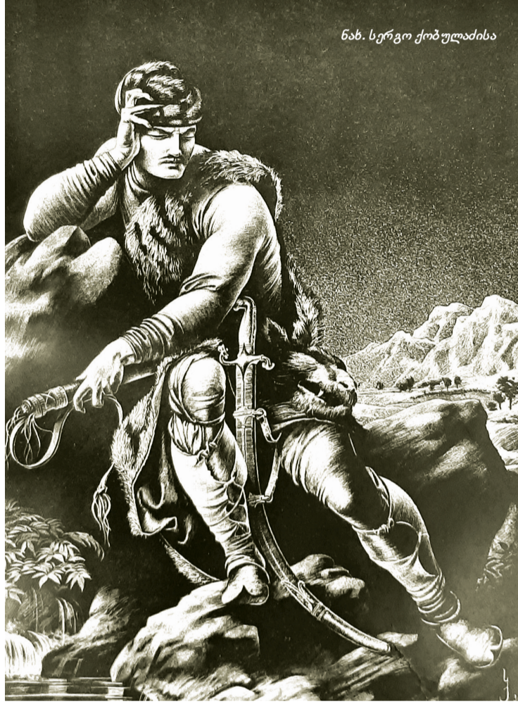
ნახ. სერგო ქობულაძისა

შეცვლა უცხოეთში გამოქვეყნებულ პუბლიკაციებს განეპირობებინოს, რომლებშიც დიდი ბელადი „ველური ქვეყნის შვილად“ გამოყვანილი. თითქოს ამ უსამართლო ბრალდების გასაცემად სტალინმა ქართული კულტურის პოპულარიზაცია განიზრახა. ირაკლი აბაშიძე გაბიძგებებს, რომ „ვეფხისტყაოსნის“ იუბილეს გამოცემა ყოფილა „მითქმა-მითქმა“, რომ ესეც სტალინის დასჭარდა მსოფლიოში თავისი ავტორიტეტის