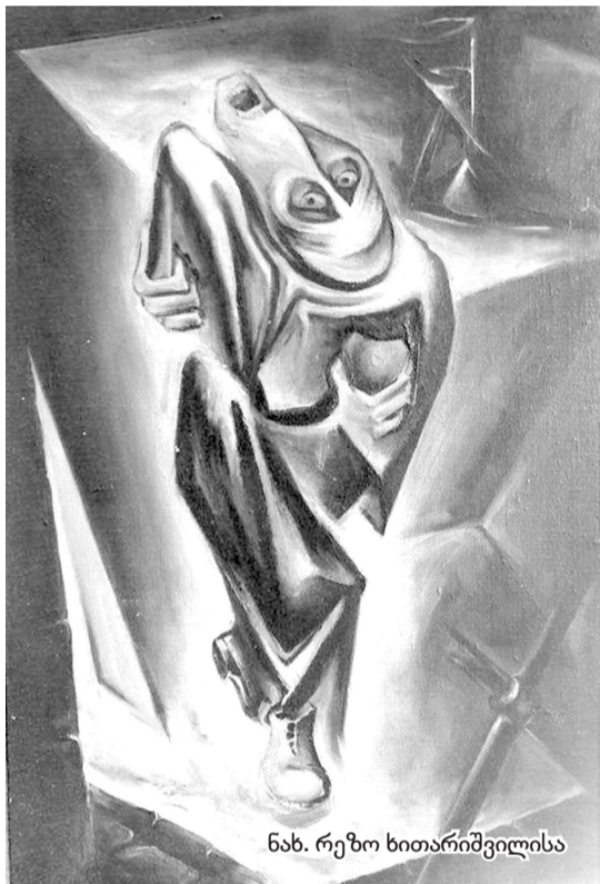
ნახ. რეზო ხითარნიშვილისა