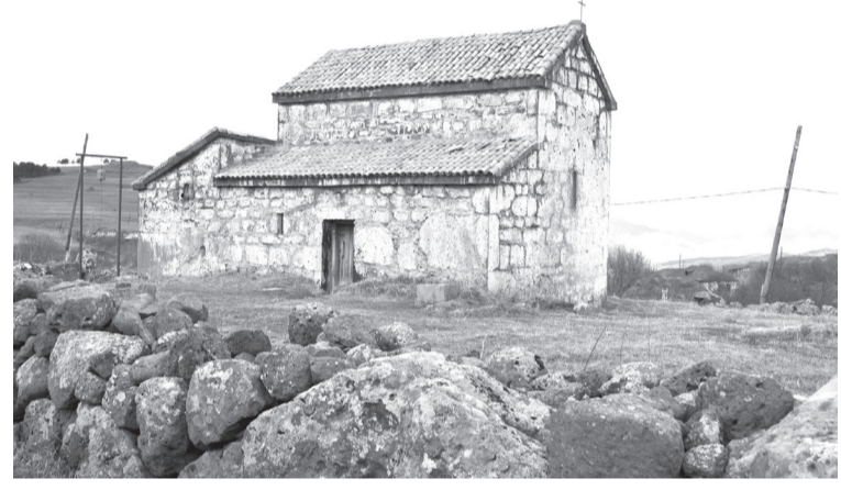
გასამაგრებელია ეს მხარენიც. ახლა ეს სოფელი ნაოხარია და ახალ-გაშენებული ქუჩა ოთხ ვერსის ქვემოთ იქმნება. ნაოხარ ქუჩისა ნაეკლესიები არის, ნელამდის კედელი ეტყობა, ნანერი არსად სწანს, მაგრამ არც აქ არის ძველი ეკლესიის ქვები დამთენილი, სხვა ქვებით შეკეთებულია; მაგრამ მაინც არც ეს დარჩენილა დაურღვეველად.

ამას წინად მე გზა მომიხდა ზველისკენ. ხიზაბავრიდან პირ-და-პირ გაველ მტკვარში ზნელასთან, გავუარე სოფლებს სახუდაველს, ონდორასა; გარდაველი ზველი და მიველ ჭობარეთსა. სახუდაველი და ონდორა ბალჩიანი სოფლები არიან. ნაეკლესიებზედ წარწერა არა არის-რა. აქაც სოფელში დარიგებულ-დაფანტულია კედლის ქვები. არც ძველი ეკლესია აზედ დამხვდა წარწერა და არცა რა ჭობარეთისა. სწანს დარღვეულ-განადგურებული ოსმალოს დროიდან ხელ-ახლავ ამენებულეობა. მის დროს კი ჩინებული ეკლესიები უნდა ყოფილიყვნენ. ამას ამტკიცებს ზველის ეკლესიის გალავანში ყოფილი ძველ სასაფლაოს ქვის ვერძები; ისეთ ცხოველად გამოჭრილ-გამოყვანილი არიან, რომ კაცს მართალი ცხოველი ეგონება. სამხრეთისკენ გალავნისა ეკვტერის შემოსასვლელი კარი ეტყობა; სწანს ძველი შენობა ეკლესიისა იქიდგან დაწყობილი ყოფილა.