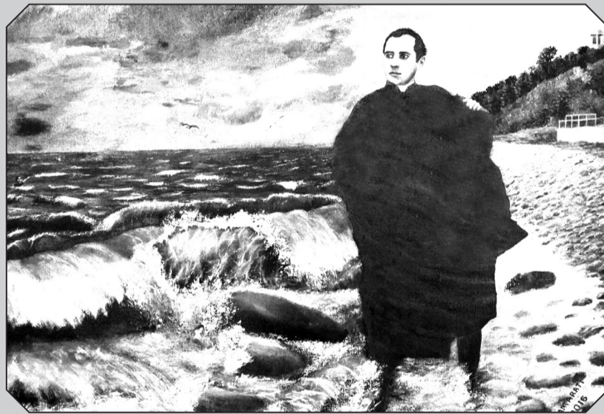
მიხეილ თამარაშვილი. 1911 წ. ნახატი 2016 წელს საქურად გადაეცა რომის პაპს საქართველოში ვიზიტის დროს. მხატვარი ნუგზარ თამარაშვილი