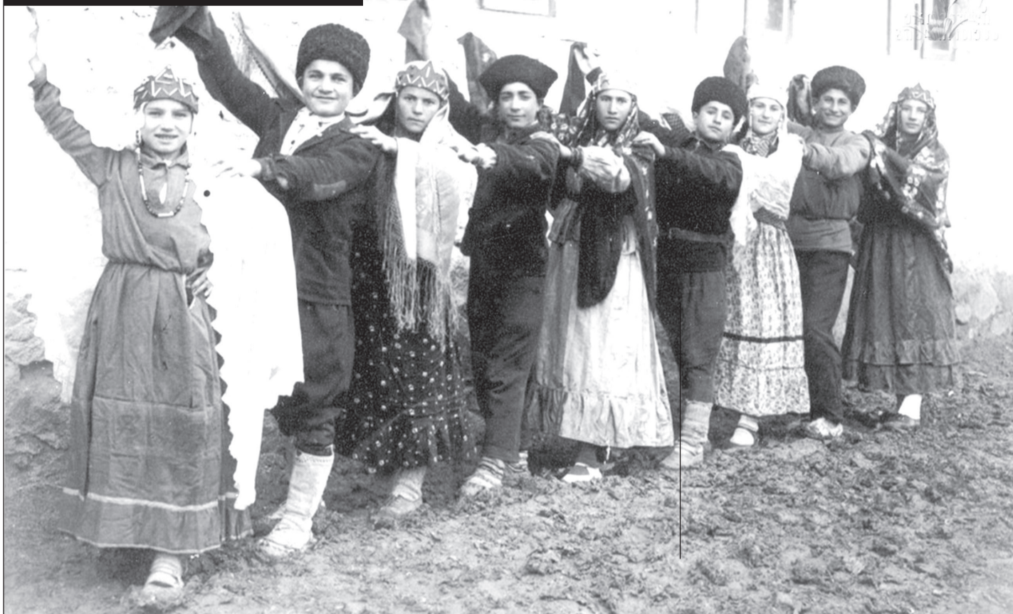
არლელუბი. სურათი გადაღებულია 1941 წელს.