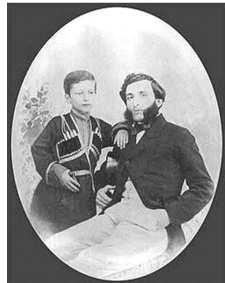
ძმები ზუბალაშვილები. 1859 წ.

ერთი ასეთი ზუბალაშვილთაგანი იყო სტ. ზუბალაშვილი, მომხსნე ერეკლესი და თავის დროის კვალად ხელოვანი ვაჭარიც. მან მეფეების დროიდანვე დაიწყო ინდოეთში მგზავრობა და იქიდან სხვა-და-სხვა საქონლის შემოტანა. მისდა საუბედუროდ, რამდენიც ეს საქართველოში მოვიდნოდა და საქონელს შეიპოვებდა, იმდენი საქონლის ფასი დაეცემოდა ხოლმე, რაც მას დიდს ზარალს აძლევდა. ამან დიდათ იზარალა და ქართველთა მეფობის შემდეგ რუსებსაც მოესწრო. რუსების დროს კიდევ მოჰკიდა ვაჭრობას ხელი, კიდევც სცადა საქმე, მაგრამ ვერ წაუვიდა კარგად, უკანასკნელ, ვგონებ, 1820-იან წლებში, საქართველოდამ სხვა-და-სხვა ვაჭრებს ინდოეთში გაჰყვა სავაჭროდ. იქიდან ის აღარ დაბრუნდა, არ ვიცით რა იქმნა, გარდაცვალა სადმე უძეოდ და მით მოსპო ინდოეთში ზუბალაშვილების გვარის შტო თუ იქ დასახლდა და დღესაც იქმნება