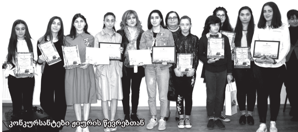
კონკურსანტები ჟიურის წევრებთან