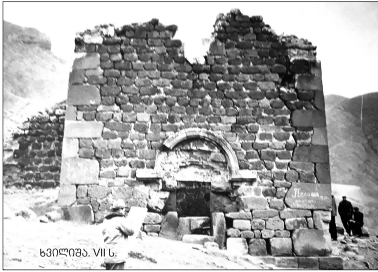
ხვილიშა. VII ს.

საქართველო და, კერძოდ, მესხეთი ყოველთვის მსოფლიო მოვლენების მონაწილე იყო. მეზობელი ჩვენივე მხოლოდ ხმლითა და ომით არ მოდიოდა. ენობრივი კონტაქტები კიდევ უფრო ძველია, ვიდრე რეალური ისტორია, ის ისტორია, ჩვენს მატიაზედა და წყაროებში რომ არის დადასტურებული. აი, ამ კონტაქტების შედეგია