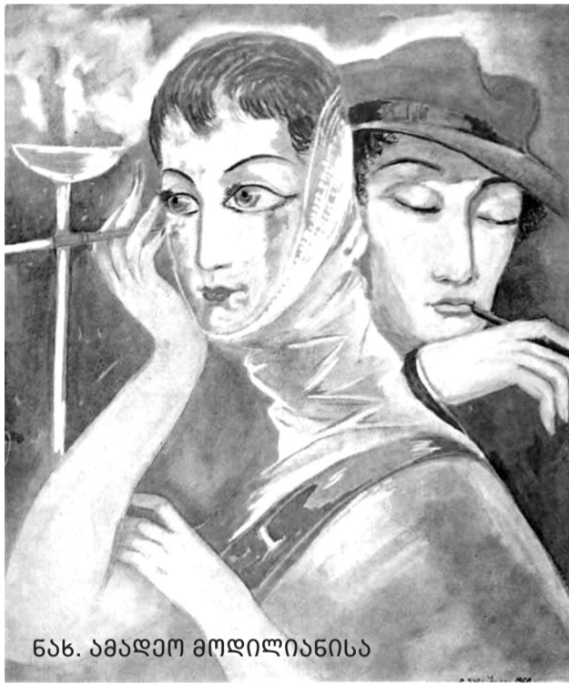
ნახ. ამაღლო მოდლიანისა