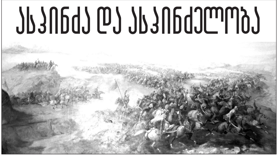
მაგრამ დღეს თითქმის დამშრალი კოხტის ხევი ერთვოდა, ეს სიმდიდრე იყო ოდიტგან და ქმნიდა პირობებს ასპინძის დანიშნურებისა.

„ახალი ქართლის ცხოვრება“ მოგვითხრობს: „ხოლო ვითარცა ესმა შაჰ-თამაზს, განიხარა ფრიად და წარმოემართა სპიჭა ურიცხვითა საათაბაგოს ზედა: მოესწრა ყაენი შაჰ-თამაზს... ვარძია, თმოგვი და ვანის ქვაბი და აწყურის, ასპინძა, ვარნეთი და სრულიად სამცხის ციხეები აღილი“. სრულიად სამცხის ციხეთა შორის მოხსენიებული ასპინძა დიდი ბრძოლის ობიექტად იქცა. ასპინძა მანც გამორჩეულად ერეკლეს სახელთან არის