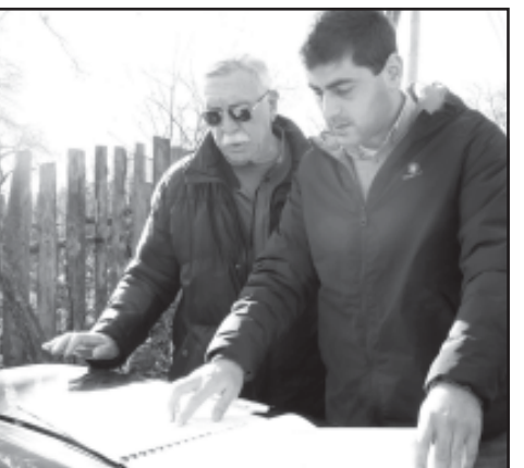
გზის სარეაბილიტაციო სამუშაოები მიმდინარე წელს დაიწყო და მომავალ წელს დასრულდება.

გზის სარეაბილიტაციო სამუშაოებისთვის ადგილობრივი ბიუჯეტიდან 1 237 601 ლარი გამოიყო.