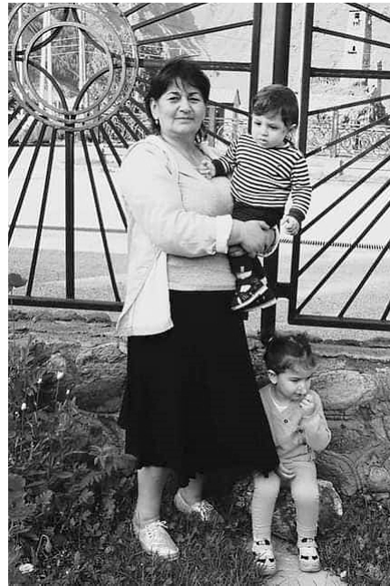
maia Svili-SvilobTan — sesilisa da vaCesTan erTad