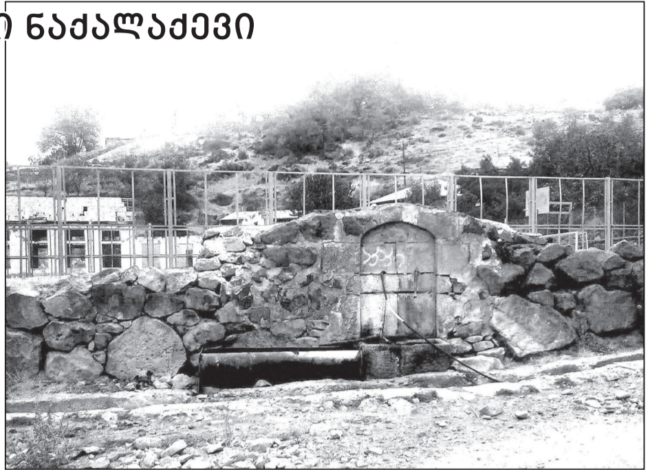
ნაძალაქები 2022 წელი