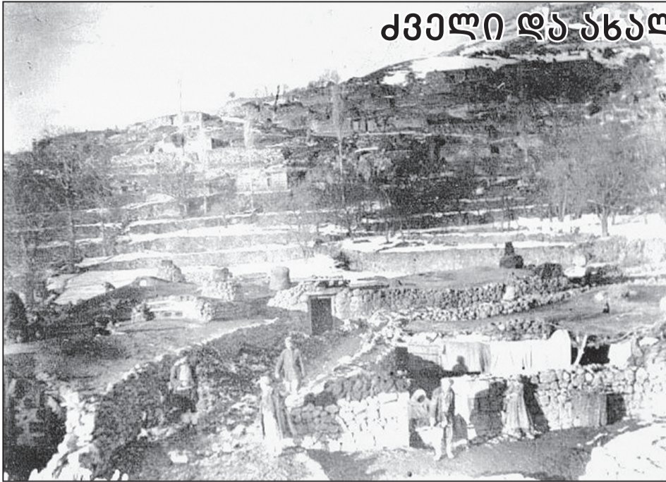
ნაძალაქები XX ს-ის 30-იანი წლები