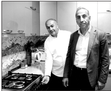
ასპინძელებისთვის ერთ დროს ოცნება იყო მოსახლეობის გაზოფიცირება. გა-

სული საუკუნის 90-იან წლებში თითქოს ეს პროცესი ადგილიდან დაიძრა, გაზგაყვანილობის მიღებამ ე.წ. დამალის ტყის ზოლამდეც მოაღწია, მაგრამ, დროთა განმავლობაში, ეს პროცესი აღარ გაგრძელდა და მხოლოდ ბოლო ხუთი წელია რაც ასპინძაში გაზოფიცირება დაიწყო და მუნიციპალიტეტის ბევრი სოფელი დღეს უკვე ამ სიკეთით სარგებლობს. ხაზგასმით უნდა ითქვას, რომ მის მიერ მოტანილმა სიკეთემ განსაკუთრებული ეფექტი მოახდინა როგორც თითოეული ოჯახის ეკონომიკურ მდგომარეობაზე, ასევე მათ კომფორტზე, – უპირველესად, ბევრგან შესამჩნევად შეჩერდა ტყის მასიური ჭრები და მოსახლეობის დიდი ნაწილი სანავადა ახლა მხოლოდ ბუნებრივ