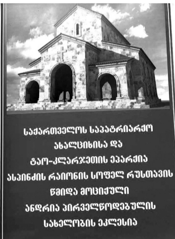
საქართველოს საპატრიარქო ახალციხისა და ტაო-კლარჯეთის ეპარქია ასპინძის რაიონის სოფელ რუსთავეში ანდრია პირველწოდებულის სახელობის ეკლესია

იყო დრო, როდესაც ეკლესიის მიმართ სხვაგვარი დამოკიდებულება გვექონდა, როცა საბჭოთა სისტემამ ეკლესია კანონგარეშე გამოაცხადა და ჩვენი უდიდესი სიმბოლოები უფუნქციოდ დარჩნენ. აქ აღარც ლოცვა აღველინებოდა, აღარც ნათლობები ტარდებოდა და, საუბედუროდ, მათი დიდი ნაწილი არადანინშულებისაგან – კოლმეურნეობების საწყობებზე იყო გადაქცეული. დრო შეიცვალა, სისტემამ ჩაილურის წყალი დალია, ხალხმა დიდი ხნის ნანატრი ოცნება აისრულა და ეკლესიისაკენ ქნა პირი. აღდგა ასობით სალოცავი, აშენდა ამდენივე ახალი ტაძარი, სამლოცველოები. დღეს, საქართველოში, იშვიათია ქალაქი, სოფელი, სადაც არ იდგეს წმინდა ტაძრები და არ მიმდებ-