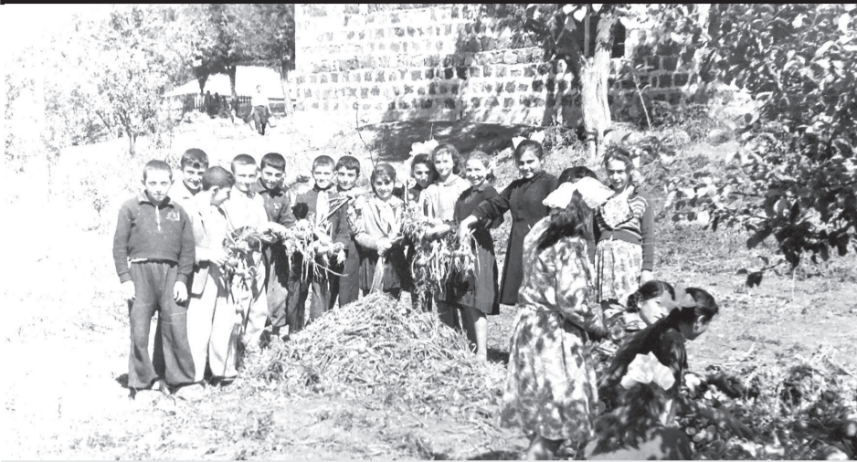
ასპინძის სკოლის მოსწავლეები. 1963წელი