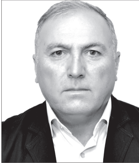
მალხაზ მოშია (ნაციონალური მოძრაობა)

დაიბადა 1968 წლის 20 ოქტომბერს დაბა ასპინძაში. 1974-1983 წლებში სწავლობდა ასპინძის საშუალო სკოლაში; 1983-1986 წლებში – ქ.თბილისის სამხედრო სკოლა-ლიცეუმში. 1990 წელს დაამთავრა ქ. დონეცკის საინჟინრო და კავშირგაბმულობის უმაღლესი სამხედრო-პოლიტიკური სასწავლებელი. 1990-1992 წლებში საბჭოთა შეიარაღებული ძალების ასეულის მეთაურის მოადგილეა; 1993-1999 წლებში – 22-ე მექანიზირებული ბრიგადის შტაბის ოპერატიული განყოფილების ოფიცერი, ქვედანაყოფის უფროსი, სატანკო ბატალიონის მეთაური, მოტომსროლელი ბრიგადის მეთაურის მოადგილე; 1998-2001 წლებში სწავლობს თურქეთის შეიარაღებული ბრიგადის კოლეჯში; 2001-2003 წლებში დაინიშნა მე-11 მექანიზირებული ბრიგადის 2003-2004 წლებში – თავდაცვის ეროვნული აკადემიის შტაბის უფროსად 2004-2005 წლებში თავდაცვის ეროვნული აკადემიის პირველი პროექტორი – სამხედრო სასწავლებლის უფროსი, ხოლო 2005-2006 წლებში – პროექტორი სამხედრო სასწავლებლის მუშაობის დარგში; 2006-2008 წლებში დაინიშნა თავდაცვის ეროვნული აკადემიის უფროსად (რეკტორად), 2008-2009 წლებში გადაწყვეტილი შეიარაღებული ძალების J-1 პ/მ დეპარტამენტის უფროსად, შემდეგ ეროვნული გვარდიის დეპარტამენტის უფროსის პირველ მოადგილედ, თავდაცვის ეროვნული აკადემიის მეთაურის მოადგილედ. 2012 წელს გაიარა დიდი ბრიტანეთის სამხედრო სამეფო აკადემიის სტრატეგიული ლიდერობის კურსი და ინიშნება საქართველოს თავდაცვის მინისტრის მრჩეველად; 2012-2016 წლებში მე-8 მოწვევის პარლამენტის წევრია. მიღებული აქვს სახელმწიფო ჯილდოები.