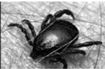
შაკები, მოგზაურები (ყირიმი-კონგოს ჰემორაგიული ცხელების ენდემურ რეგიონებში).

ყირიმი-კონგოს ჰემორაგიული ცხელება (CCHF) მსოფლიოში ფართოდ გავრცელებული დაავადებაა, რომელსაც იწვევს ვირუსის სახეობა – Nairovirus, ოჯახი Bunyviridae. ვირუსი გადაეცემა ტკიპის მეშვეობით და იწვევს მძიმე ჰემორაგიული ცხელებას, როგორც ერთეული შემთხვევების, ასევე აფეთქების სახით. ადამიანი უფრო ხშირად ინფიცირდება ტრანსისივლად, ტკიპების კენით და ავადმყოფი ცხოველების სისხლთან და ქსოვილებთან უშუალო კონტაქტით. ადამიანიდან ადამიანზე გადაცემა შესაძლებელია დაავადებული ადამიანის სისხლთან და ბიოლოგიურ სითხეებთან შეხებისას, სამედიცინო მანიპულაციების დროს ყირიმი-კონგოს ჰემორაგიული ცხელება განსაკუთრებით ვერაგი დაავადება იმ თვალსაზრისითაც, რომ დამახასიათებელია მაღალი ლეტალობის (10-40%) მაჩვენებელი. როდის ხდება ადამიანი ავად ყირიმი-კონგოს ჰემორაგიული ცხელებით?