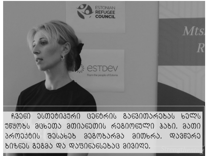
ჩვენი ესთეტიკური ცენტრის განვითარებას ხელს უწყობს მცხეთა-მთიანეთის რეგიონული ჰაბი. მათი პროექტის შესახებ მაგობარმა მიტხრა. დავწერა ბიზნეს გეგმა და დაფინანსებას მივიღე.

ადამიანები, რომლებსაც ჩვენ დევნილებს ვუ-