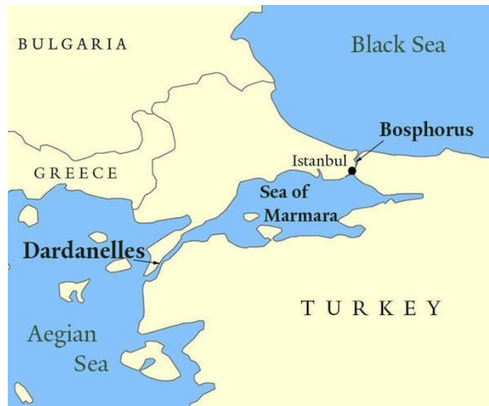
ბოსფორის და დარდანელის სრუტეები

როგორც ბოსფორისა და დარდანელის სრუტეების მაკონტროლებელი. აღნიშნული სრუტეები აკავშირებს შავ ზღვას ეგეოსის ზღვასთან, შესაბამისად ხმელთაშუა ზღვასთანაც. ამ სრუტეების წყალობით, რუსეთს მხოლოდ ერთი გზა აქვს დაუკავშირდეს ხმელთაშუა ზღვას, შემდეგ კი მსოფლიო ოკეანეებს.