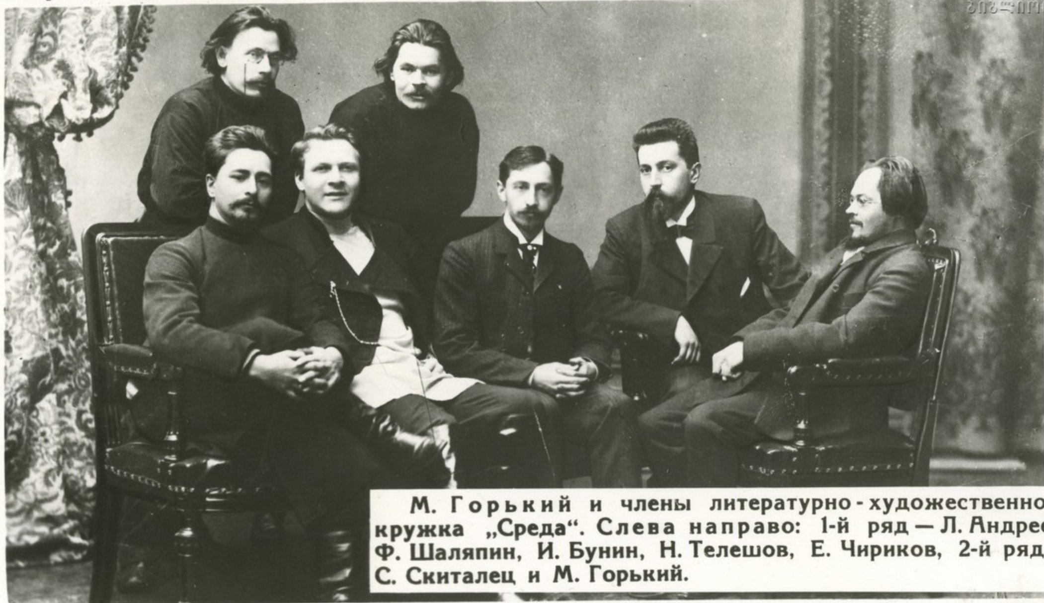
М. Горький и члены литературно - художественного кружка „Среда“. Слева направо: 1-й ряд — Л. Андреев, Ф. Шаляпин, И. Бунин, Н. Телешов, Е. Чириков, 2-й ряд — С. Скиталец и М. Горький.

Литературно-художественный кружок „Среда“