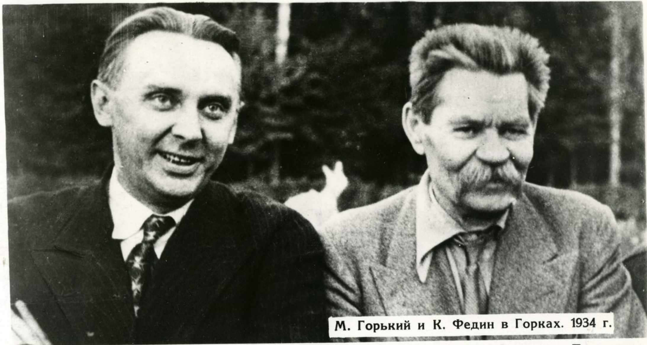
М. Горький и К. Федин в Горках. 1934 г.

М. Горький принял горячее участие в судьбе К. Фебина. Большое значение для К. Фебина имела оценка Алексея Максимовича его романа „Города и годы“. К. Федин всегда прислушивался к советам Горького, вместе с ним обсуждал общие проблемы литературного творчества, имеющие актуальное значение для развития молодой советской литературы.