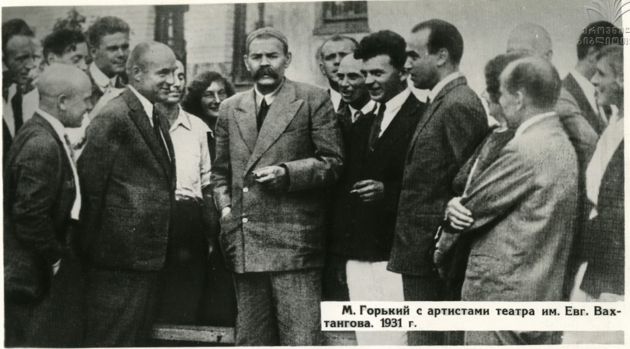
М. Горький с артистами театра им. Евг. Вахтангова. 1931 г.

На сцене театра имени Евг. Вахтангова в 1931 г. была поставлена пьеса М. Горького „Егор Булычов и другие“. Автор пьесы принимал участие в постановке, присутствовал на репетициях. Сохранился режиссерский экземпляр пьесы с пометками М. Горького.