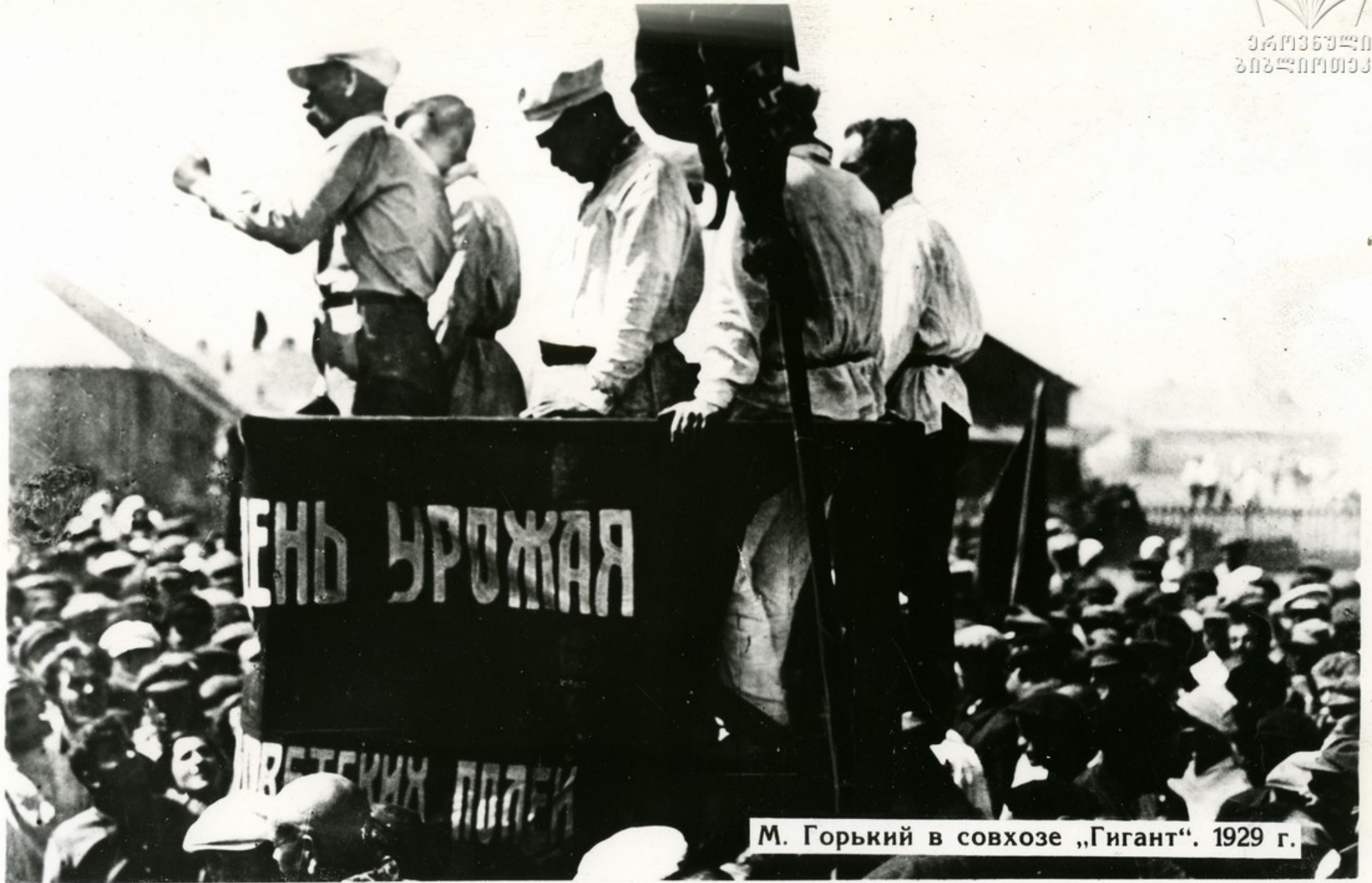
М. Горький в совхозе „Гигант“. 1929 г.

„Всюду видишь, как разумная человеческая рука приводит в порядок землю, и веришь, что настанет время, когда человек получит право сказать: „землю создал я разумом моим и руками моими“.