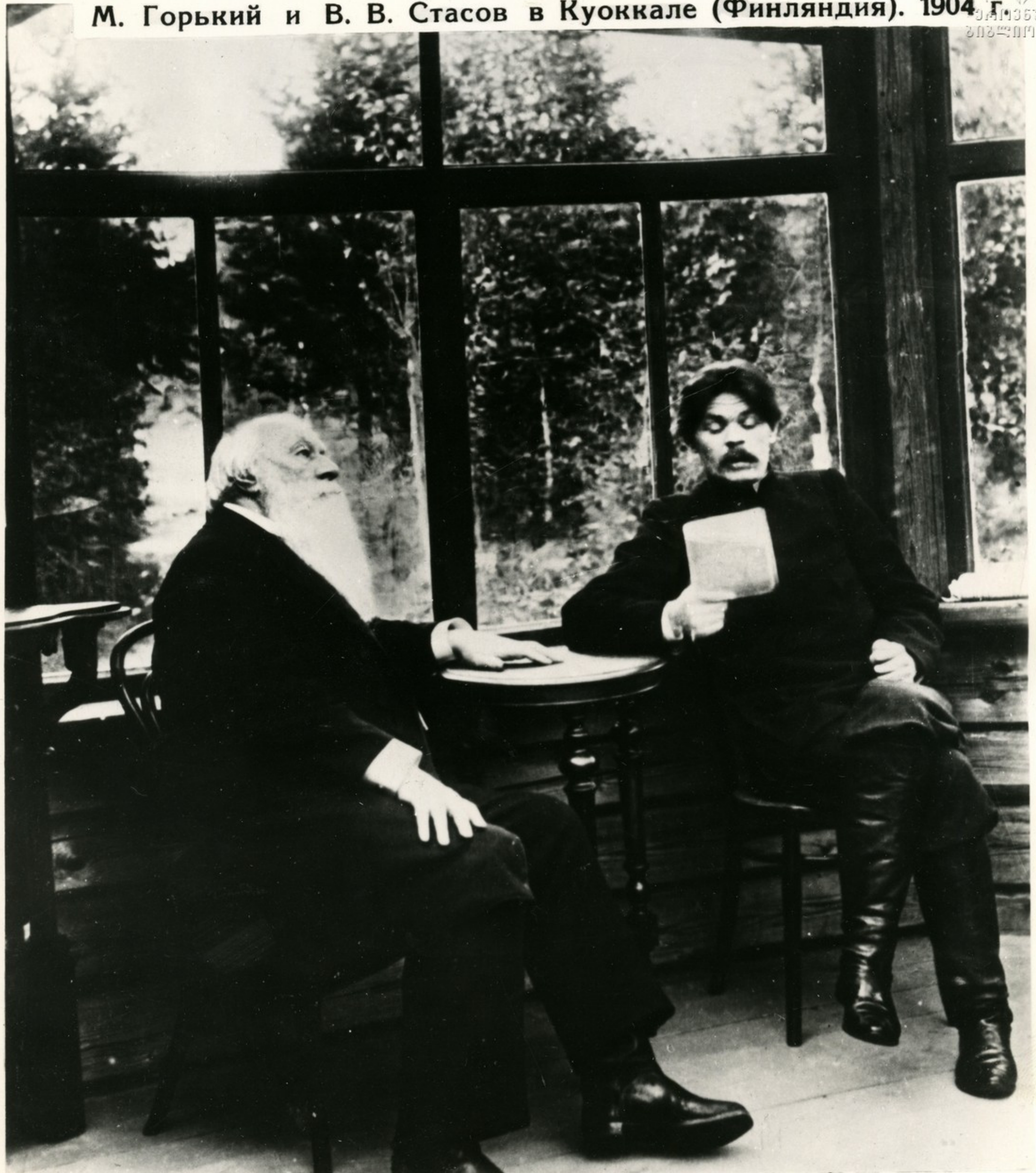
М. Горький и В. В. Стасов в Куоккале (Финляндия). 1904 г.

„ ...Мне радостно будет вспоминать о встречах с Владимиром Васильевичем (Стасовым), который в старости своей любил жизнь, людей, искусство...“