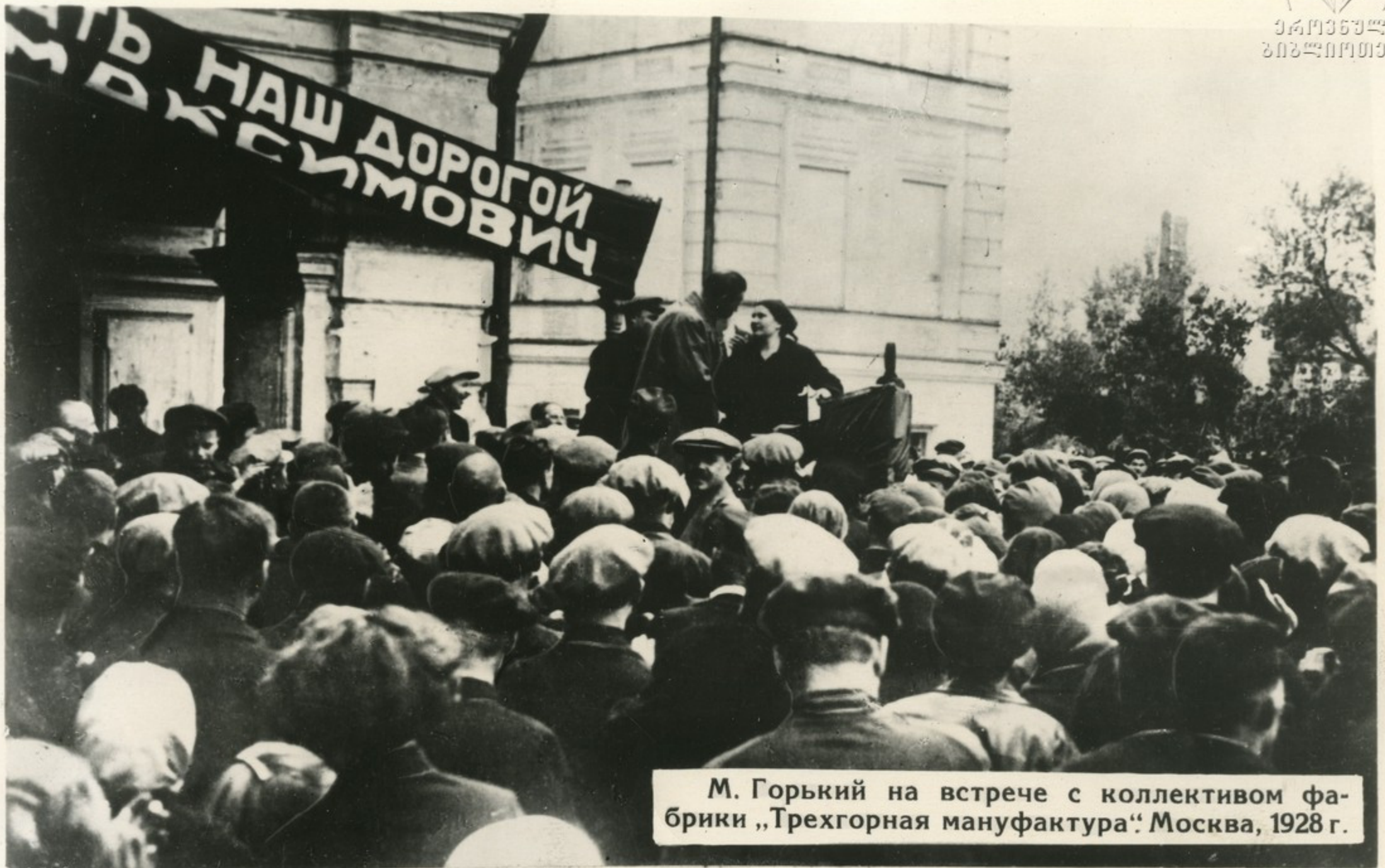
М. Горький на встрече с коллективом фабрики „Трехгорная мануфактура“ Москва, 1928 г.

„Мне так кажется, что я в России не был не шесть лет, а по крайней мере двадцать. За это время страна помолодела. Такое впечатление, что среди старого, в окружении старого растет новое, молодое. Дома старые, а люди новые.