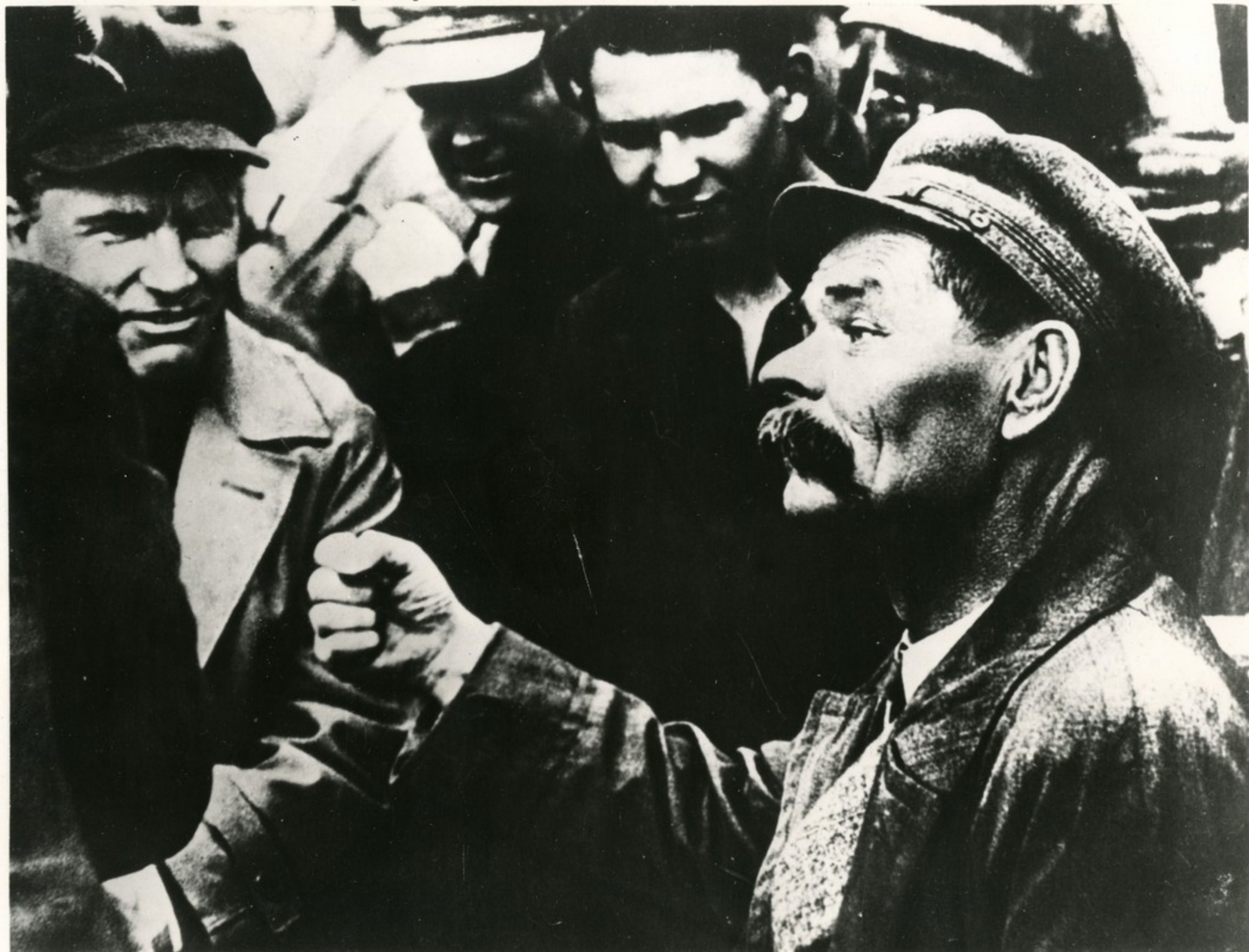
М. Горький и С. М. Киров на Балтийском заводе. 1929 г.