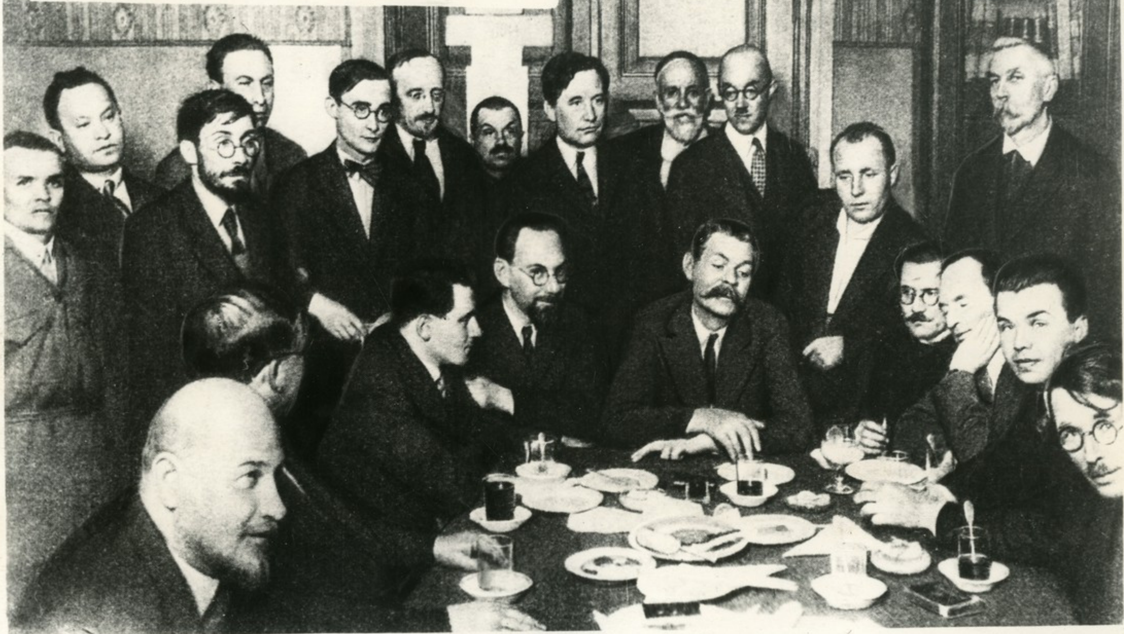
Встреча М. Горького с писателями в „Доме Герцена“. Москва, 1928 г.

„Дело наших литераторов – трудное, сложное дело. Оно не сводится только к критике старой действительности, к изобличению заразительности ее пороков. Их задача изучать, оформлять и тем самым утверждать новую действительность“.