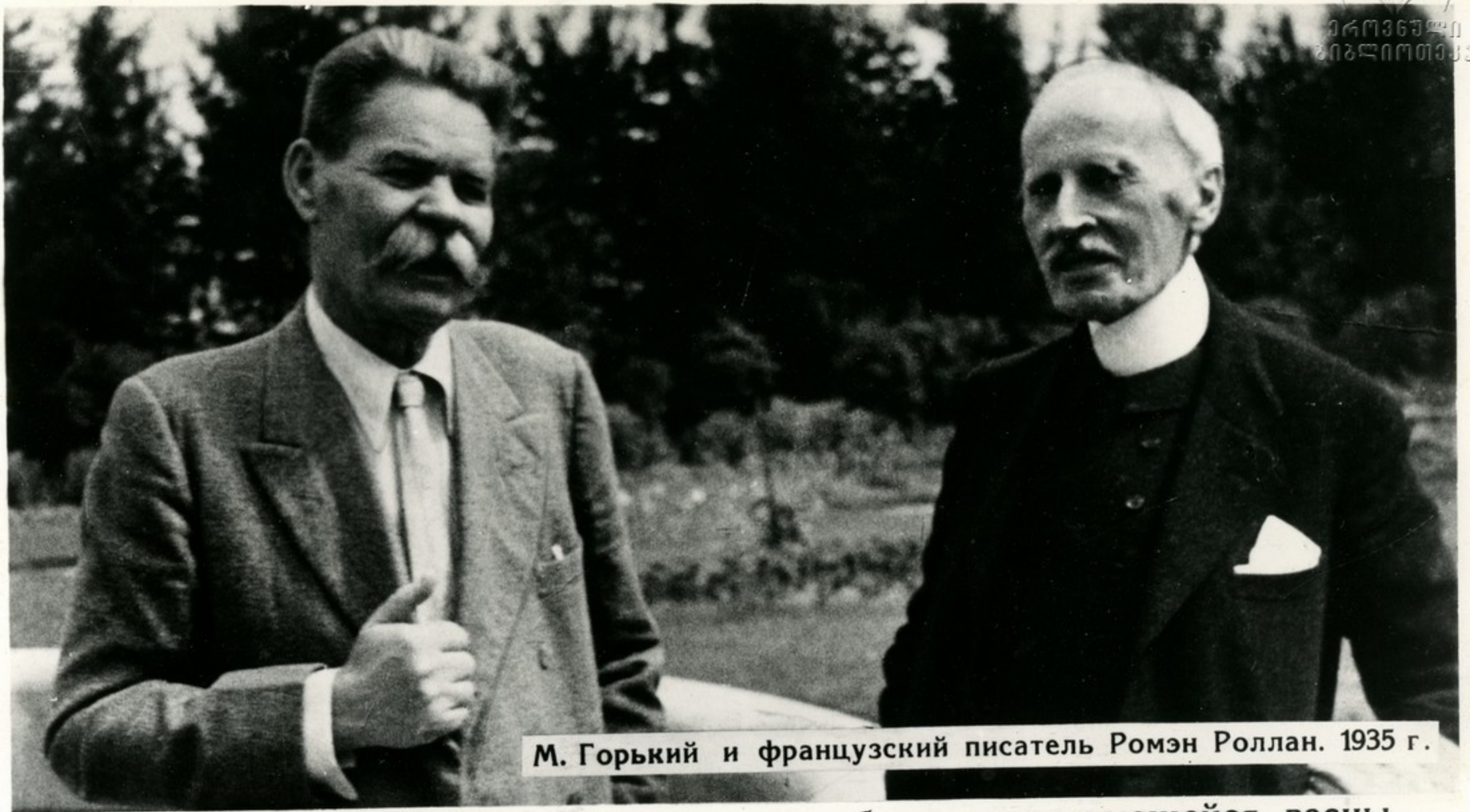
М. Горький и французский писатель Ромэн Роллан. 1935 г.

„Вы родились на ущербе зимы, на рубеже зарождающейся весны, в пору приближения равноденствия. Это совпадение символизирует Вашу жизнь, которая была связана с гибелью старого мира и с возникновением, среди бурь, мира нового.