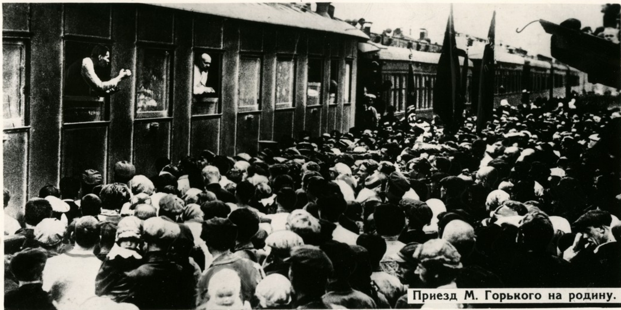
Приезд М. Горького на родину.

Горький путешествует по Советскому Союзу. В 1928-1929 г.г. он побывал на Волге и Украине, в Крыму и на Кавказе, в Мурманске и на Соловках. Результатом этих поездок были циклы очерков „По Союзу Советов“ и „Рассказы о героях“.