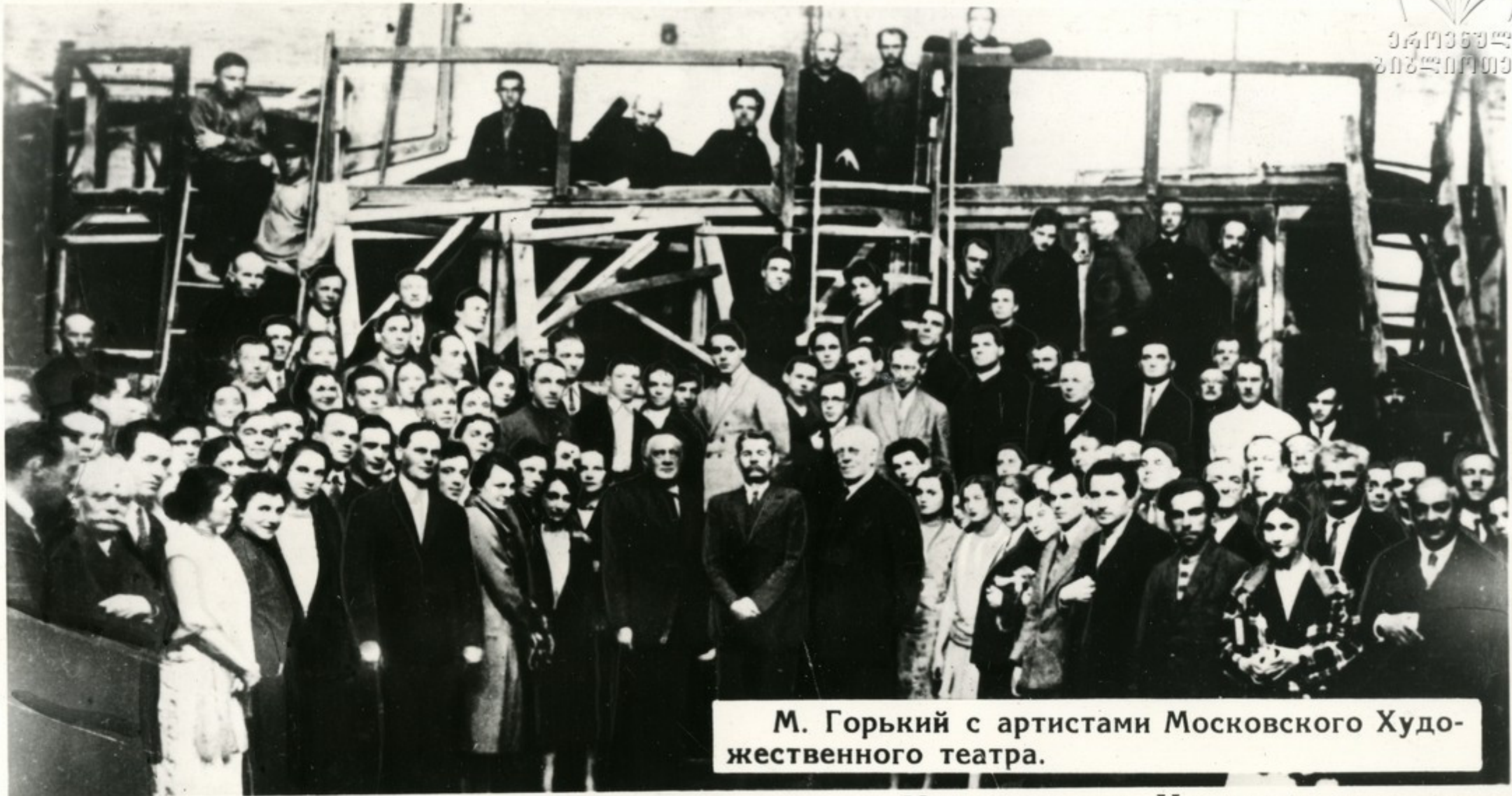
М. Горький с артистами Московского Художественного театра.

Тесная дружба связывала Горького с Московским Художественным театром. На его сцене в 1902 г. была поставлена первая пьеса М. Горького „Мещане“, знаменовавшая приход на сцену нового героя — передового рабочего. На сцене МХАТ'а шли пьесы М. Горького „На дне“ (1902), „Дети солнца“ (1905), „Враги“ (1907), продолжающие свою сценическую жизнь и в наши дни. „... Как чудесно много сделано вами для русского искусства... какой мощный толчок дали вы развитию театра России, Европы, Америки“.