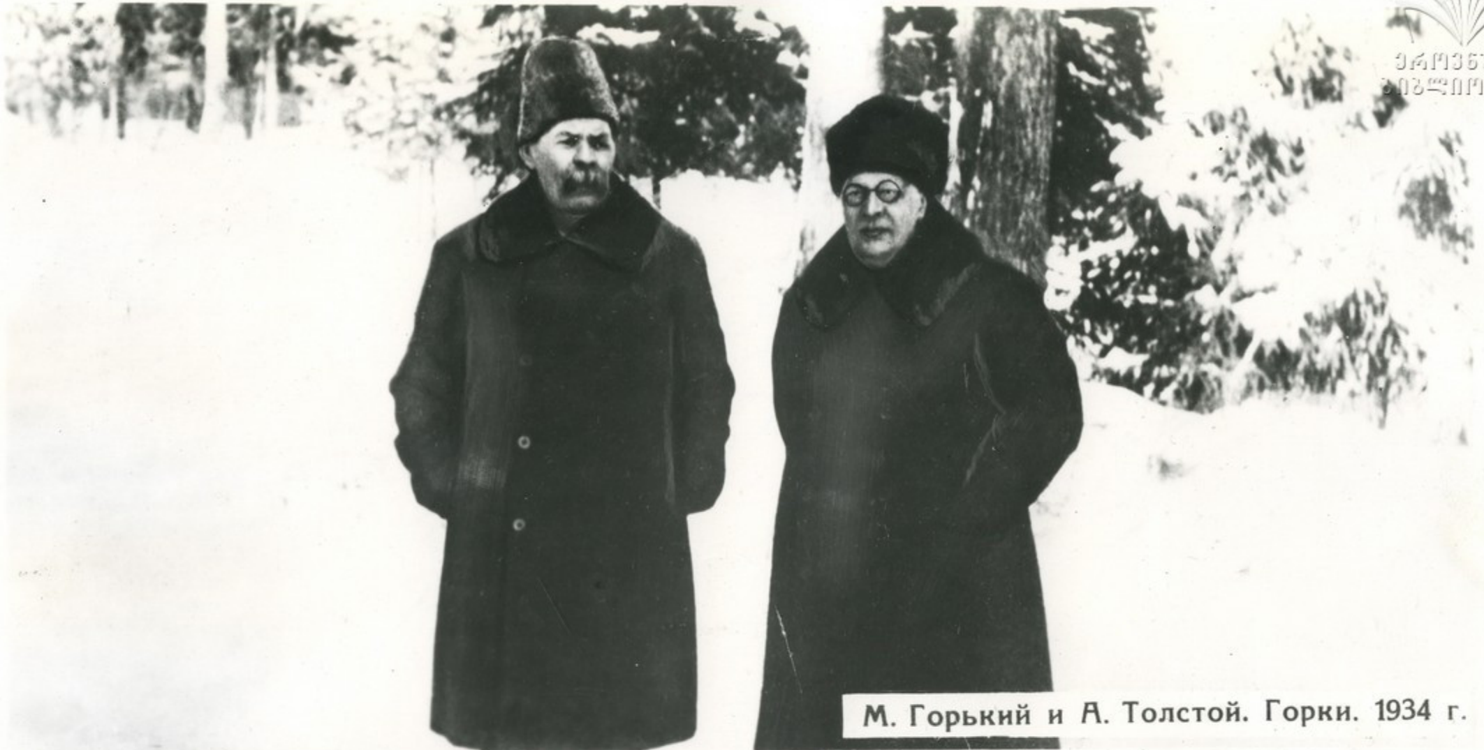
М. Горький и А. Толстой. Горки. 1934 г.

Близкое знакомство М. Горького и А. Н. Толстого, перешедшее в дружбу, началось в 1922 г. А. Н. Толстой видел в Горьком старшего мудрого друга, советам которого он всегда следовал.