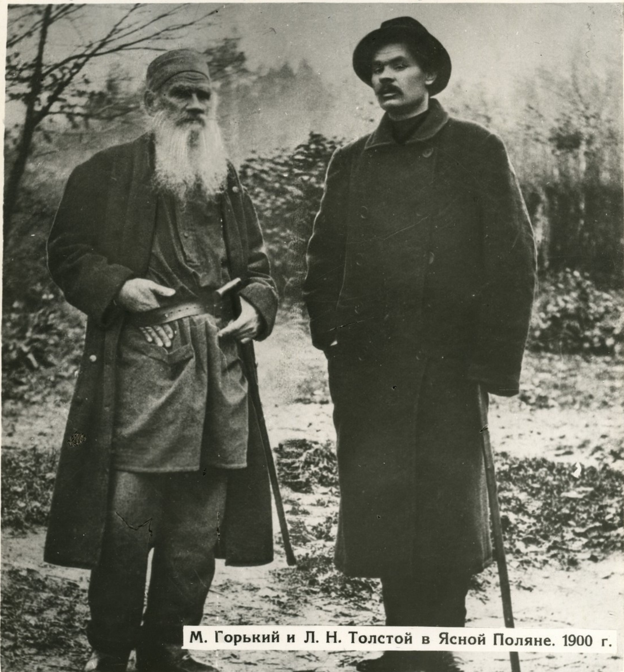
М. Горький и Л. Н. Толстой в Ясной Поляне. 1900 г.

„По совести скажу—видеть себя на карточке рядом со Львом русской литературы,—мне невыразимо ра- достно! Горжусь этим ужасно“.