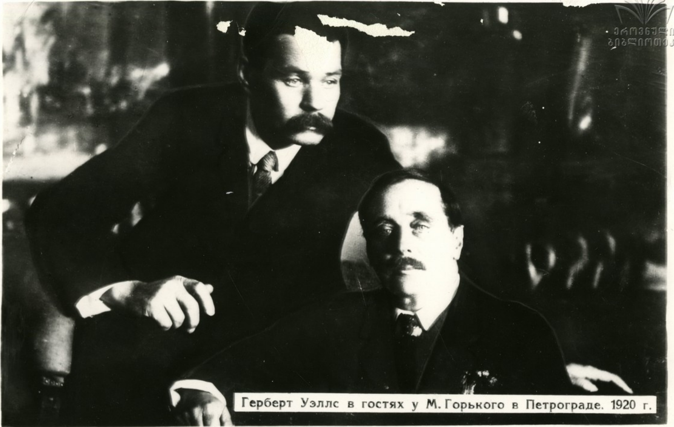
Герберт Уэллс в гостях у М. Горького в Петрограде. 1920 г.

Английский писатель, автор книги „Россия во мгле“ Г. Уэллс приехал в 1920 г. и пробыл пятнадцать дней в Петрограде и Москве. Он был гостем М. Горького и жил у него на квартире.