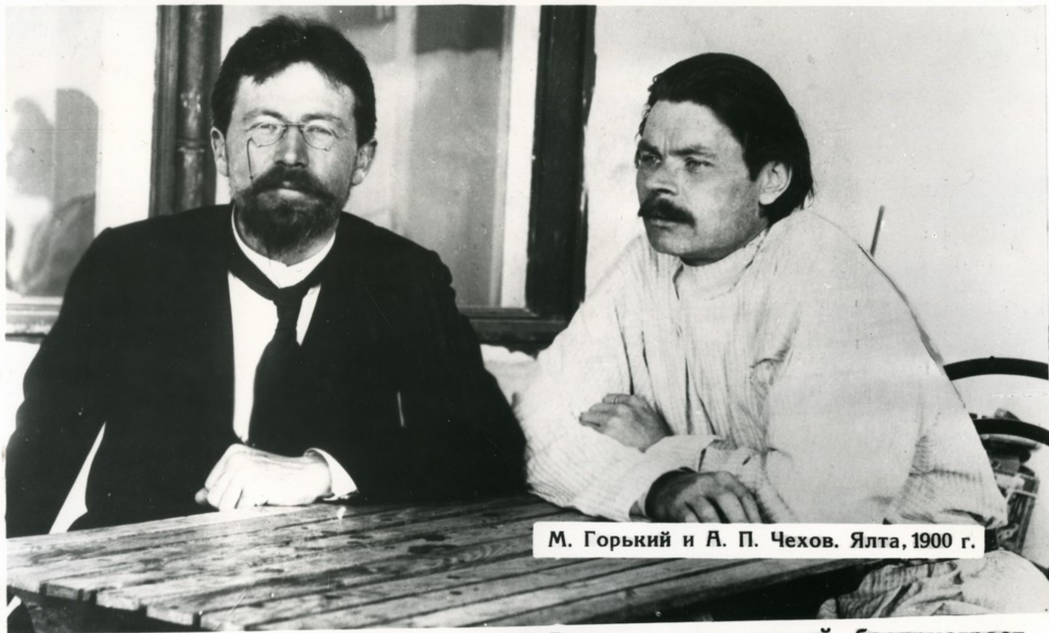
М. Горький и А. П. Чехов. Ялта, 1900 г.

„Чехов... один из лучших друзей России, друг умный, беспристрастный, правдивый,—друг любящий ее, сострадающий ей во всем, и Россия... долго не забудет его“.