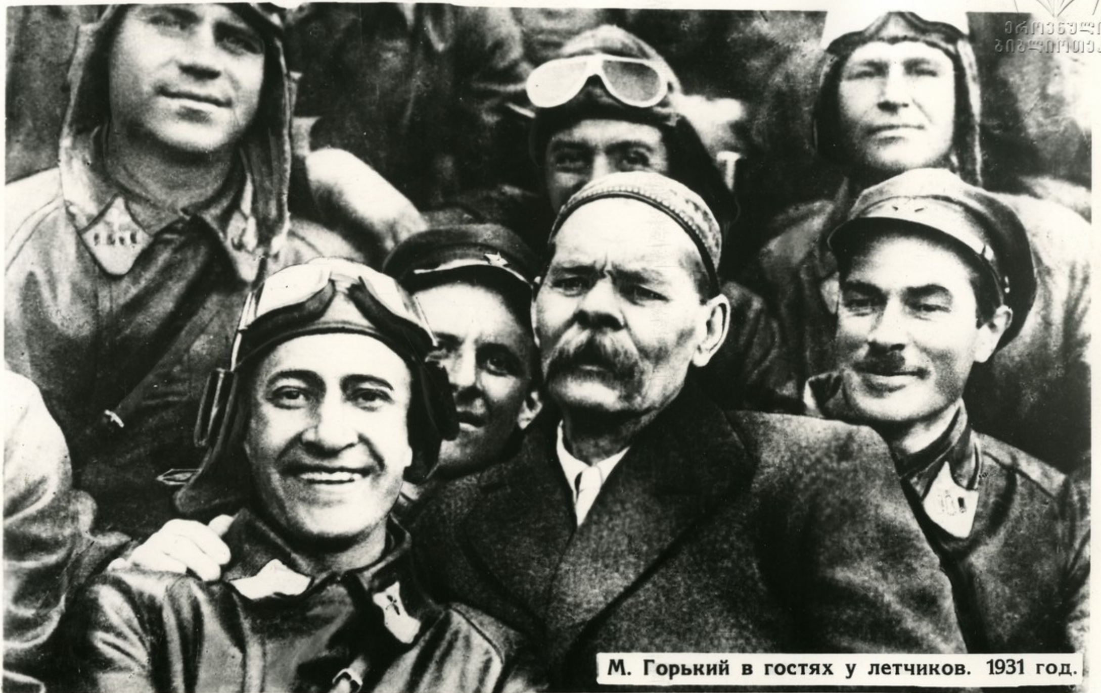
М. Горький в гостях у летчиков. 1931 год.

„...вы являетесь первой армией, которая служит только народу и защищает только его интересы“.