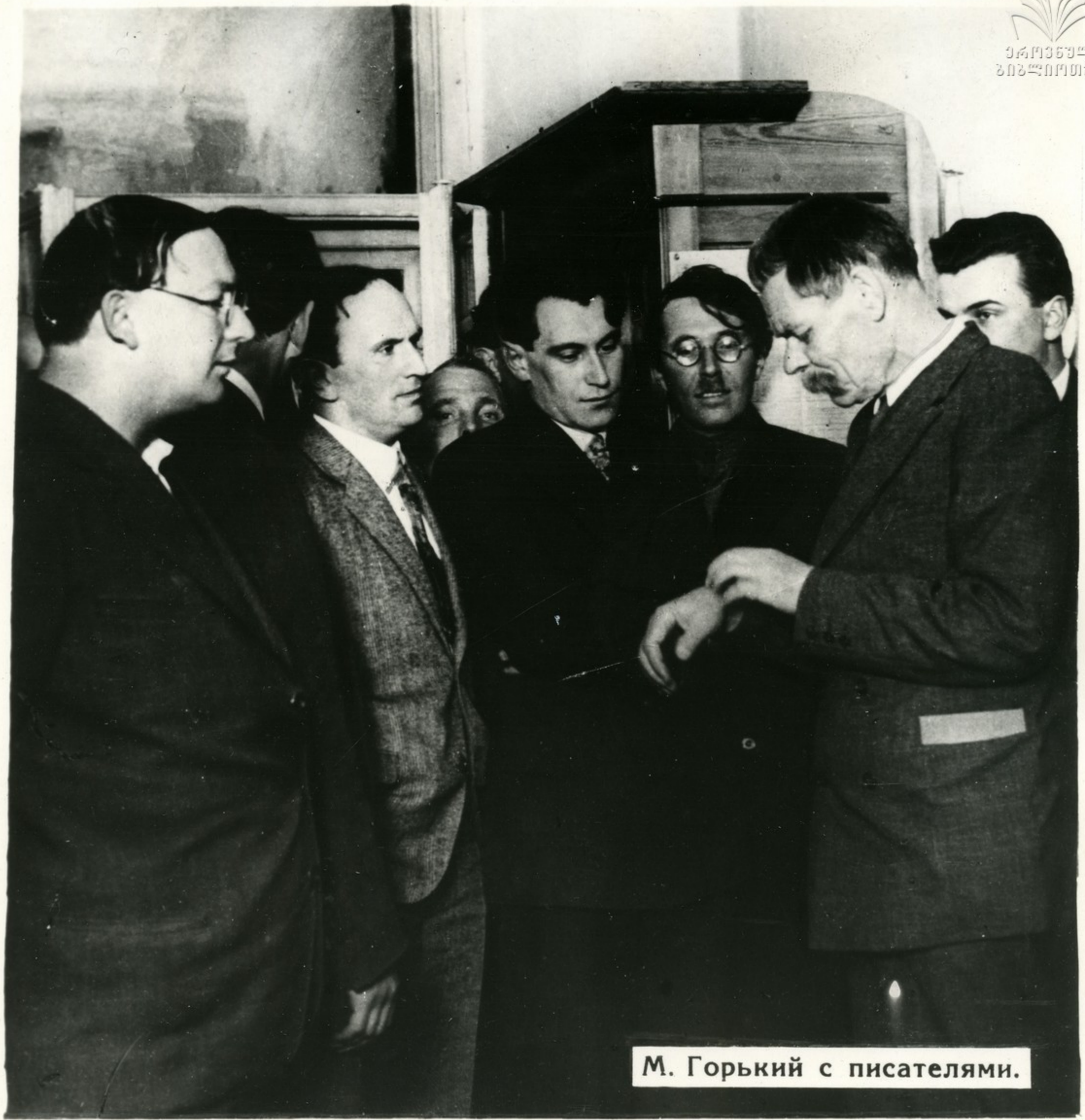
М. Горький с писателями.

Замечательный художник, Горький был и крупным критиком, теоретиком литературы, организатором и руководителем советской литературы, мудрым и чутким наставником многих советских писателей.