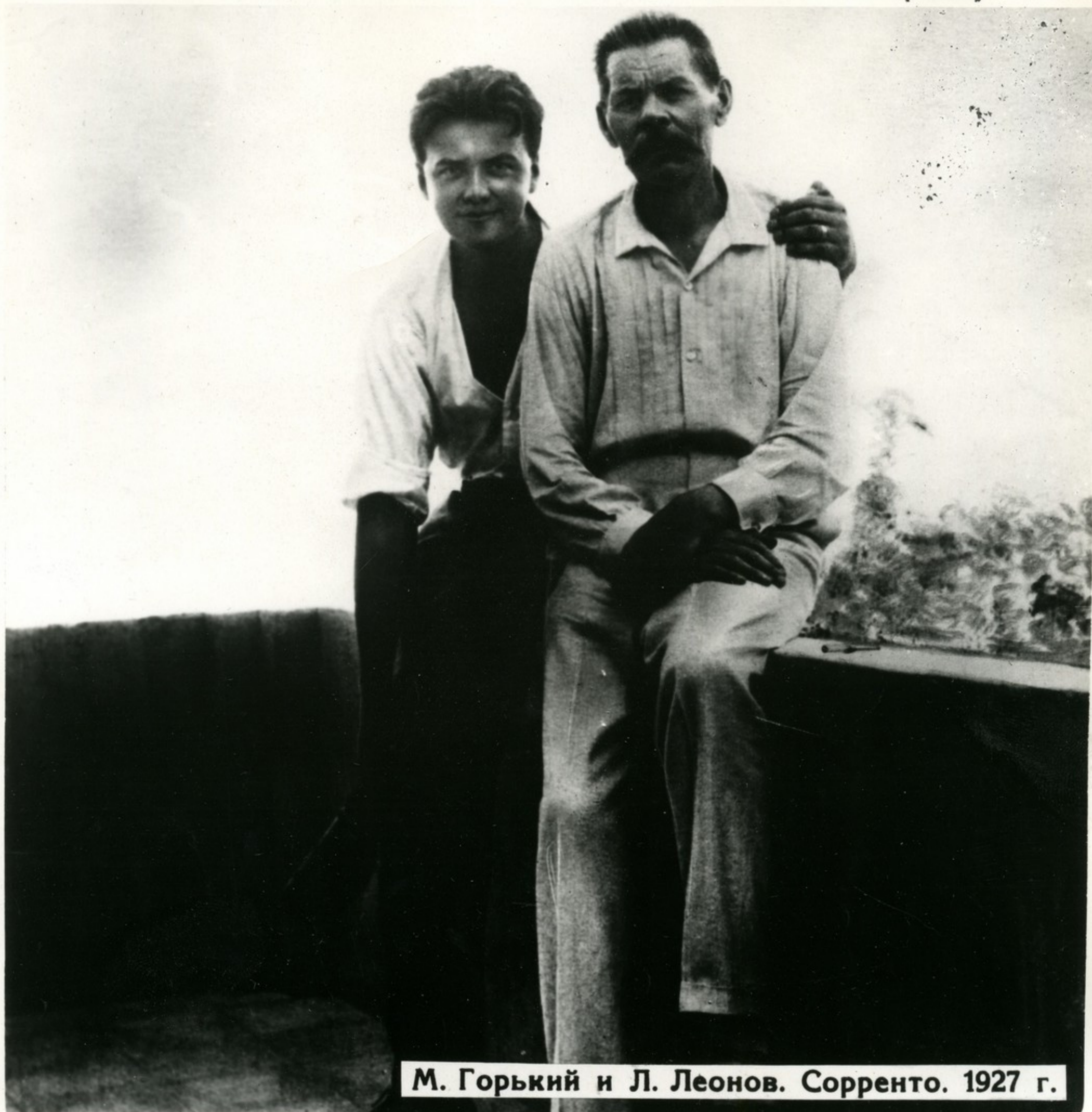
М. Горький и Л. Леонов. Сорренто. 1927 г.

М. Горький горячо интересовался творчеством Л. Леонова и предсказывал ему большую будущность. Впервые он познакомился с его произведениями в 1924 г. и пригласил писателя сотрудничать в журнале „Беседа“. „В Леонове чувствуется большой русский писатель“.