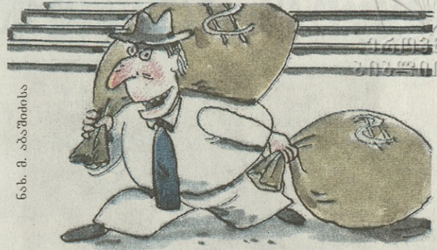
ნ. ა. მ. აბაშიძის