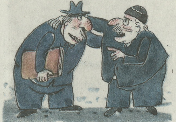
- ეს ის არაა, შემსალაროს უფროსი რომ იყო?!