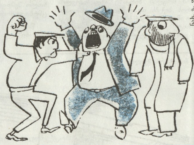
ნახ. პ. ფირცხალავასი