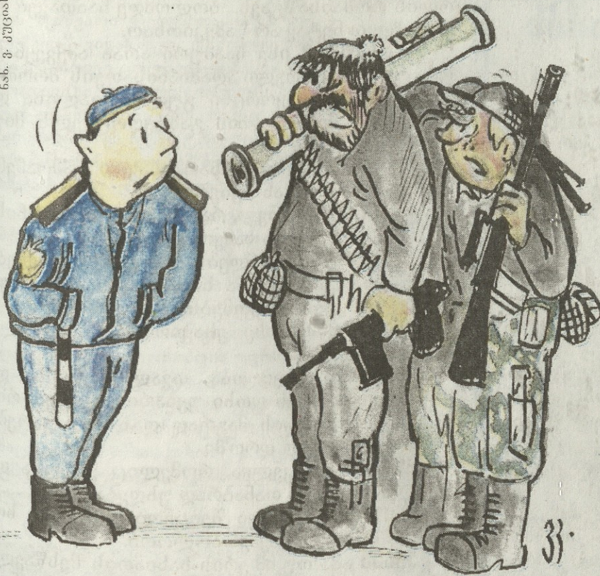
- ვერ მიმასწავლი კრწანისის გზას?!