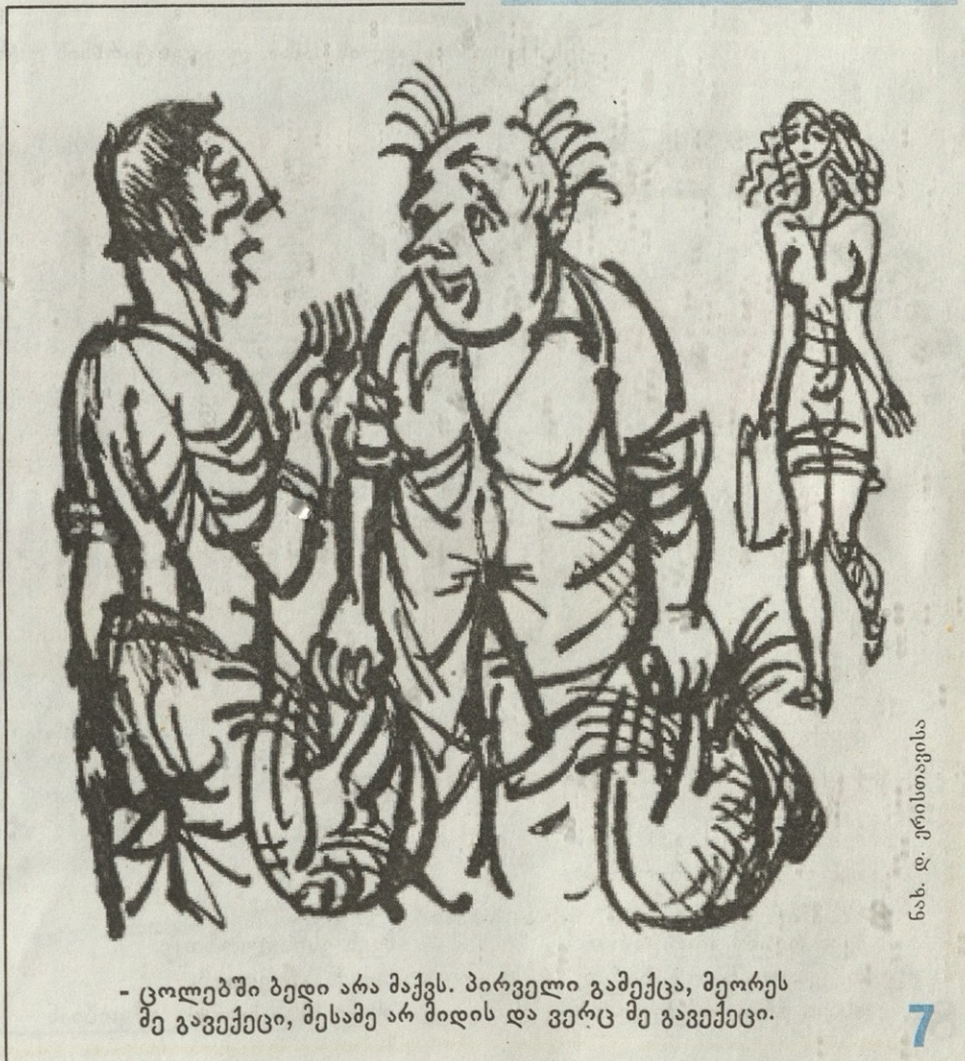
ნ.ხ. დ. კერესელიძის

- რა ჩემ ფეხებად მინდა ორი ცარიელი ჭიქა?