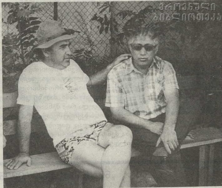
კაცი მღეროდა. ქვემოდან დავუძახე: თუ შეიძლება „მხოლოდ შენ ერთს“ იმღერეთ-მეთქი.