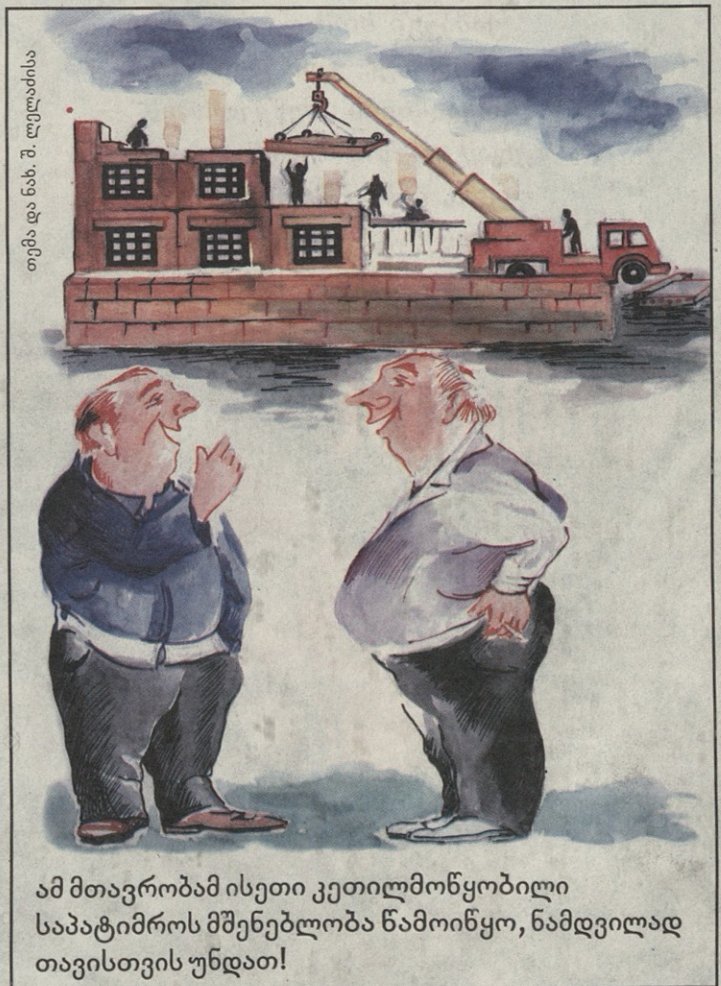
თემა და ნახ. შ. ლუღაბისა

ამ მთავრობამ ისეთი კეთილმოწყობილი საპატიმროს მშენებლობა წამოიწყო, წამდვილად თავისთვის უნდათ!